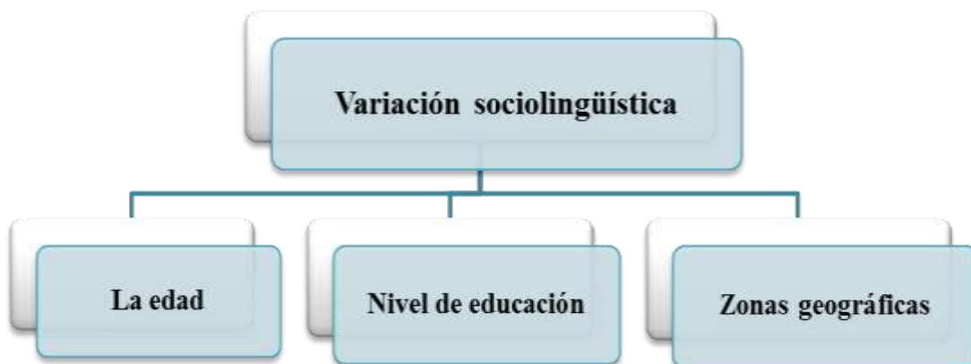
Figura 7: Variación sociolingüística (Elaboración propia).

En este trabajo de investigación nos centraremos solo en tres elementos principales de la sociolingüística que son: la edad, el nivel de educación y las zonas geográficas, porque son los elementos más influyentes en estos dos términos.