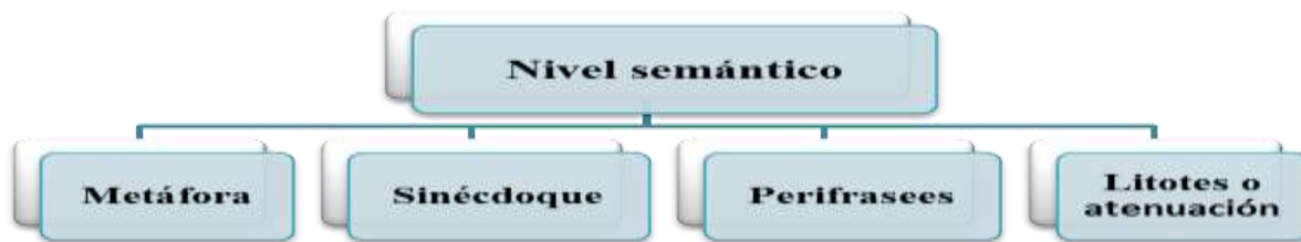
Figura 9: Elementos semánticos (Elaboración propia)