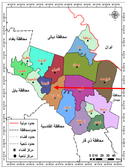
خريطة ( ٢ ) موقع قضاء النعمانية من محافظة واسط الوحدات الإدارية لمحافظة واسط

شمالا وخطي طول ( ٣١ ٤٤ ° ) ، ( ٣٤ ° ٤٦ ) شرقا يحدها من الشمال ديالى ومن الشمال الغربي محافظة بغداد ومن الغرب