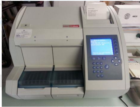
الصورة (1) توضح جهاز minividas