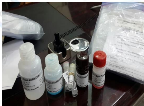
الصورة (2) توضح عدة قياس cytomegalovirus باستخدام Eliza