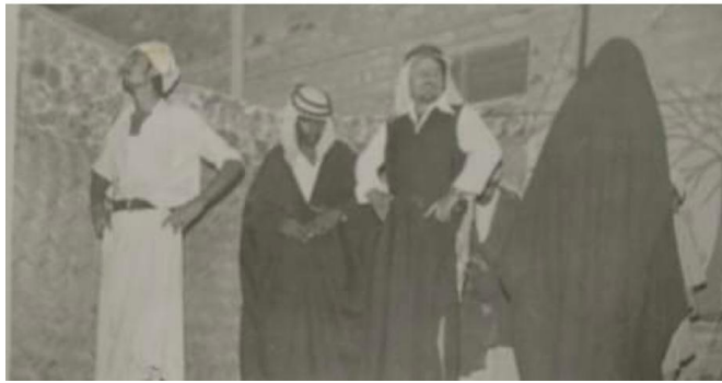
مسرحية فتاح فال تقديم فرقة مسرح الطليعة عام ١٩٦٢