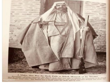
الشيخ فالح الصيهدود