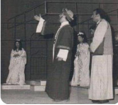
من تاريخ المسرح الميساني