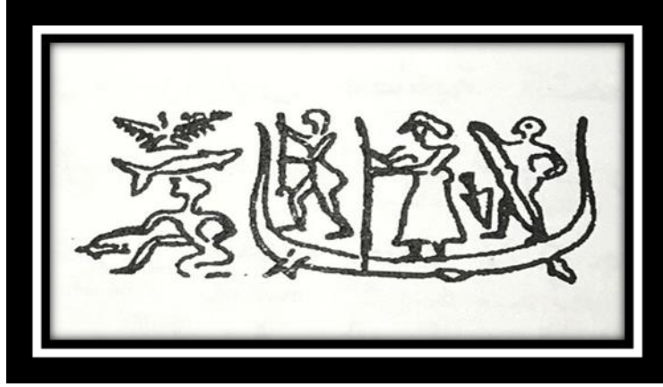
(شكل رقم ٥) بوتس، دانيال تي، حضارة وادي الرافدين، المصدر السابق، ص ١٩١

وهناك مشهد لرجل عاري وحيوان يعيش بين القصب وتظهر ازهار وجرة (ينظر الشكل رقم ٦) (٢٧) .