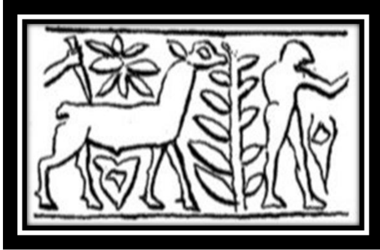
(شكل رقم ٦)

وهناك مشهد لرجل عاري وحيوان يعيش بين القصب وتظهر ازهار وجرة (ينظر الشكل رقم ٦) (٢٧) .