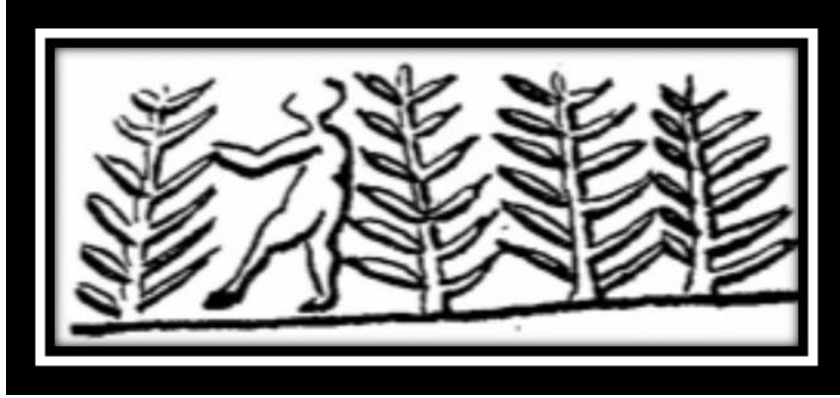
(شكل رقم ١)

. 14.,PL Cit. OP, Ur excavations archaic seal impressions ,L.Dg.Legrain