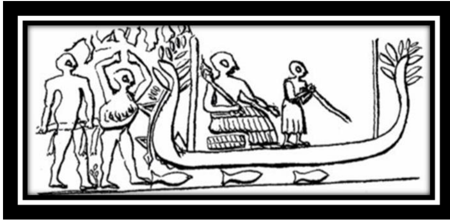
(شكل رقم ٢)

كما عثر في اور على ختم يظهر قارب في الاهوار يتم سحبه من قبل رجلين، احدهما مع أيدي مرفوعة والثاني معقوده وهناك اسماك تسبح في الماء اسفل القارب التي زينة مقدمته بأوراق الزينة ووجود اشخاص يحملون مظلة فوق راس الشخص الجالس في القارب وهو الشخصية الرئيسية في المشهد يرتدي تنورة قصيرة، وشخص ثاني يقوم بالتجذيف كما يوجد قصب طويل في كلا الجانبين من القارب (ينظر الشكل رقم ٢) (٢٣).