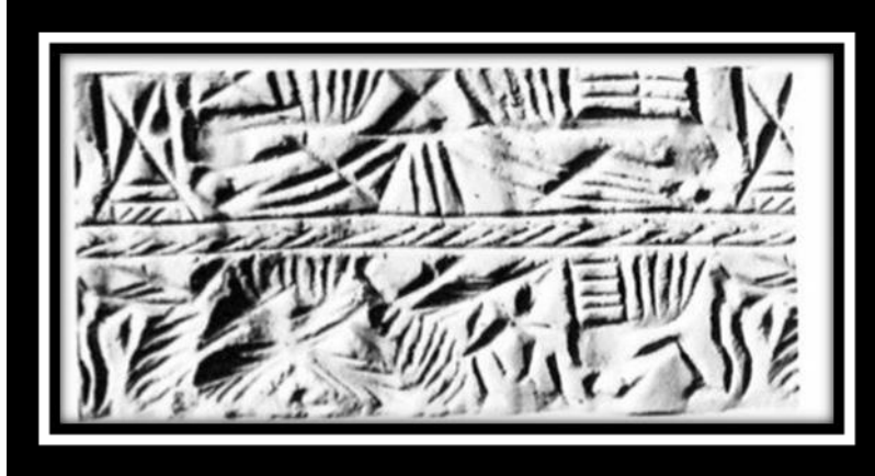
(شكل رقم ٩)

و على مشهد اخر نشاهد اشخاص وهم يستخدمون عيدان القصب في الشرب (ينظر الشكل رقم ٩) (٣٠).