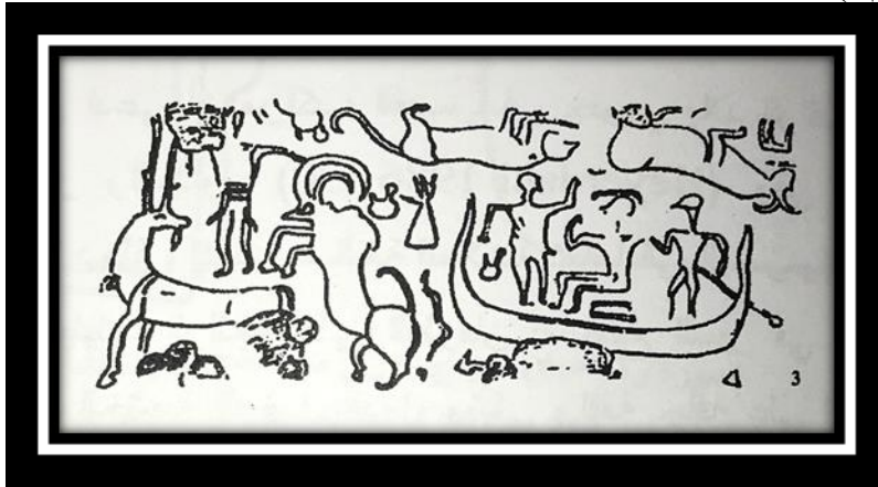
(شكل رقم ٤)

ومن تل اجرب عثر على طبعة ختم تحمل مشهد قارب يحمل ثلاث اشخاص الشخص الرئيسي جالس في الوسط اما الشخصين الآخرين احدهم يجذف باستخدام المجذاف والثاني يرفع يده بوضعيات مختلفة، ويحيط بالقارب مجموعه من حيوانات من الثيران والوعول (ينظر الشكل رقم ٤) (٢٥).