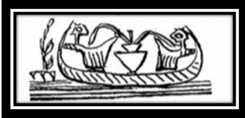
(شكل رقم ١٣)

وعلى ختم اخر نشاهد اثنين من الرجال داخل قارب في الاهوار وهما يشربان من خلال أنبوب من القصب من جرة بينهما (ينظر شكل رقم ١٣) (٣٤) .