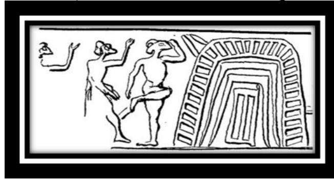
(شكل رقم ١١)

وهناك ختم اخر يحمل مشهد لكوخ من القصب كبير وتجري بالقرب منه طقوس دينية معينة يؤديها سكان الاهوار، يظهر الكوخ بهيئة مقوسه ومفروش بالقصب (ينظر شكل رقم ١١) (٣٢) .