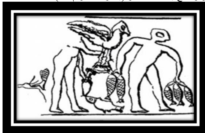
(شكل رقم ١٢)

وحمل طبعة ختم اسطواني صورة لصياد عاري يحمل بيده خمسة اسماك، ورجل اخر يحمل جرة، ويظهر كائن غير واضح يعتقد انه طائر (ينظر شكل رقم ١٢) (٣٣) .