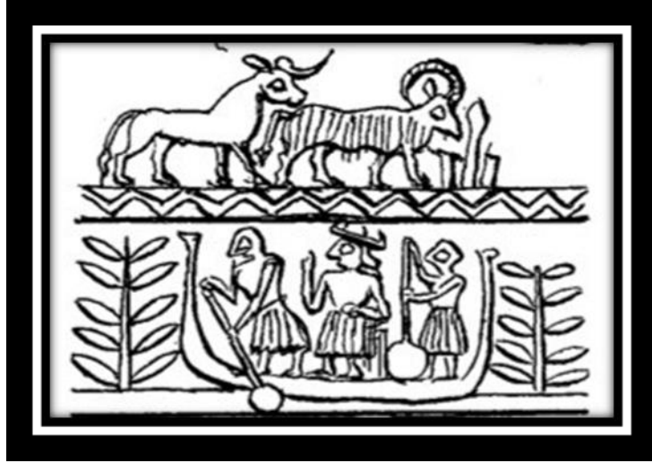
(شكل رقم ٣)

.28. PL، Cit. OP ، Ur excavations archaic seal impressions ،L.Dg.Legrain