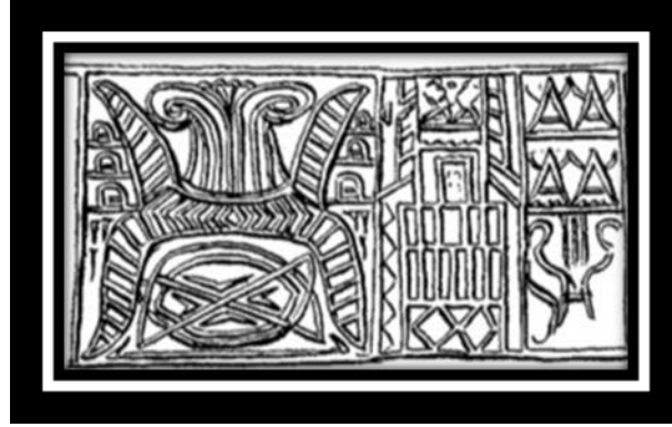
(شكل رقم ١٠)

. 20. PL, Cit. Ur excavations archaic seal impressions , OP, L. Dg. Legrain