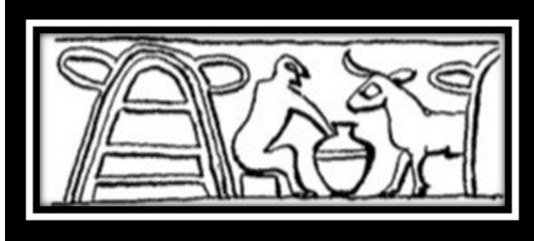
(شكل رقم ٧)

ومن نبات القصب شيبت الاكواخ للماشية اذ نشاهد على ختم كوخ من القصب يجلس بالقرب منه رجل وهو يحمل جرة، وثور واقف في منتصف الطريق (٢٨) (ينظر الشكل رقم ٧).