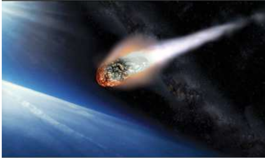
- الشهب -