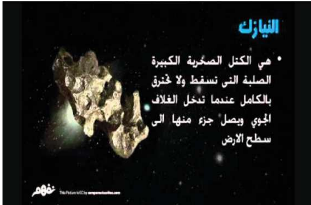
- النيازك -