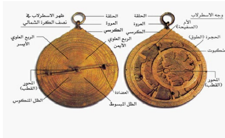
الصورة ٥ / رسم توضيحي يبين تكوين الاسطرلاب

https://Samarkand_observatoire_ulugh_beg.jpg