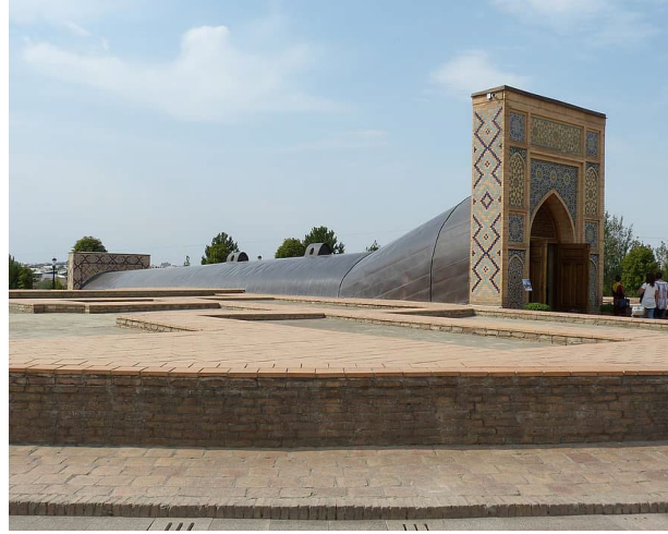
الصورة ٣ / مرصد اولوغ بيك في سمرقند