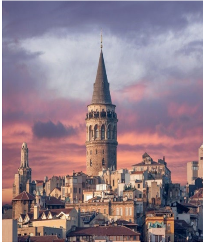
الصورة ٤ / برج غطة