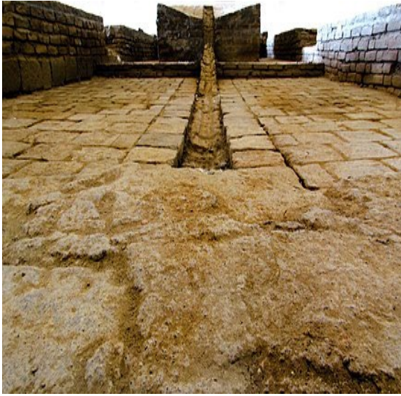
الصورة ٢ / المرصد الفلكي في مراغة https://www.wikiwand.com/ar