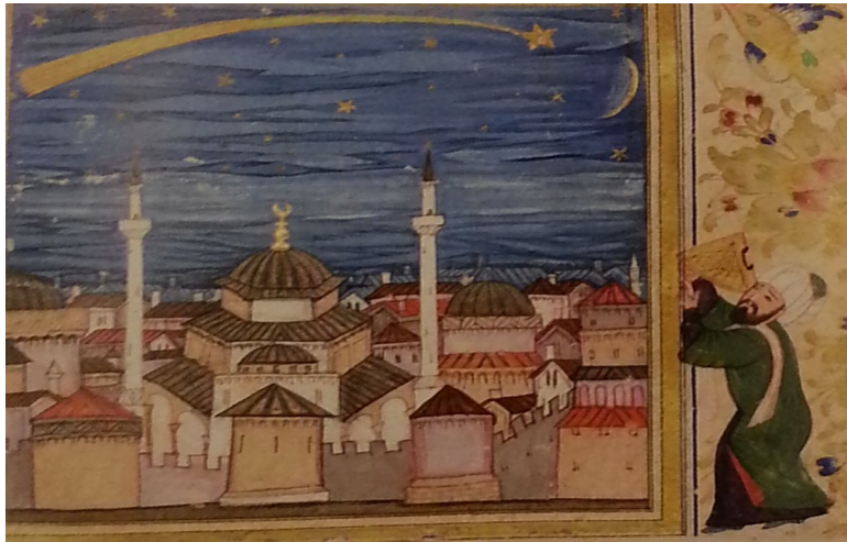
المنمنمة ٣ / تقي الدين يرصد المذنب الكبير

Fetvacı. Picturing history at the Ottoman court ,pl.5.02