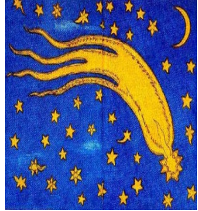
المنمنمة ٤ / مذنب استانبول