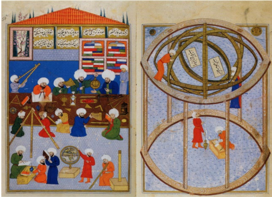
المنمنمة ٢ / مرصد استانبول الفلكي وهيأته العلمية pl.89, Tanindi. Ottoman painting, Gagman & Bagc&