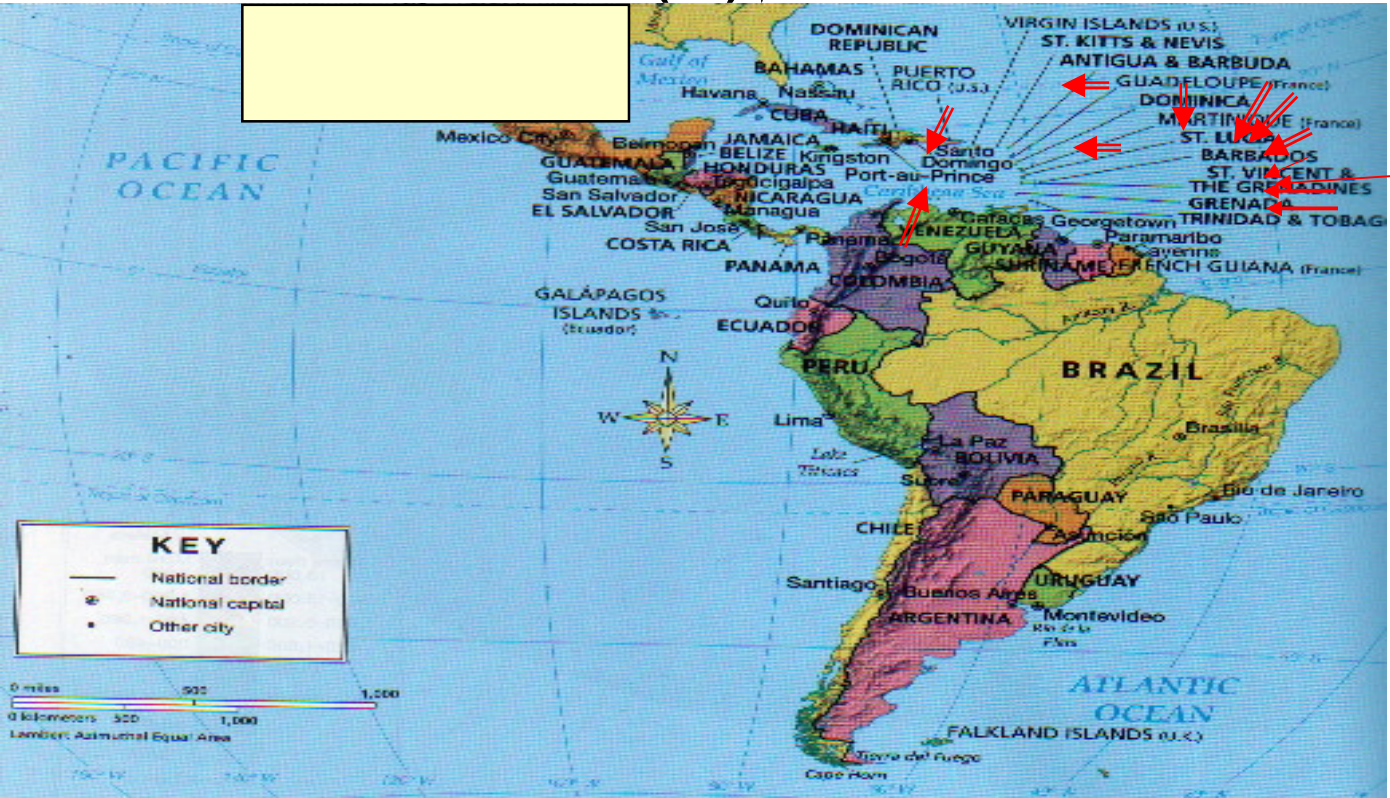
* WWW. CIA World Face book. Contries of the world – 21 years of CIA World Face book. July 2009.