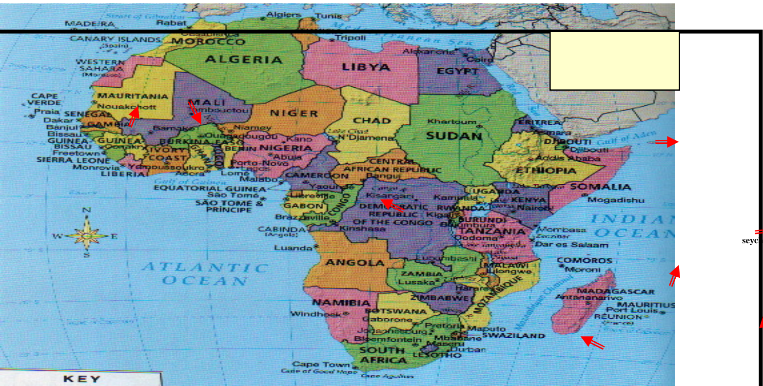
1. CIA World Face book. Contries of the world – 21 years of CIA World Face July 2009