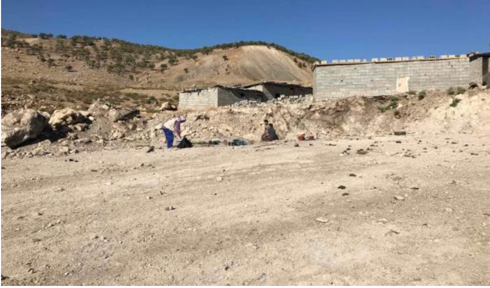
الشكل ٧: معثر الكنز.