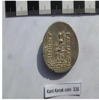
الشكل ٥-أ : مسكوكة فضية من كنز سریشمة تعود الى الملك ديميتريوس، مع لقب سوتر منقوش تحت العرش.