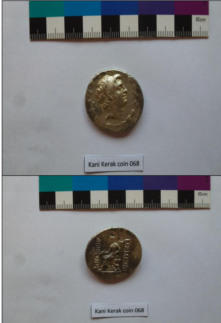
الشكل ٣-أ : مسكوكة فضية من كنز سريشمة تعود الى الملك ديميترىوس، من دون لقب سوتر. ( تصوير الباحث).