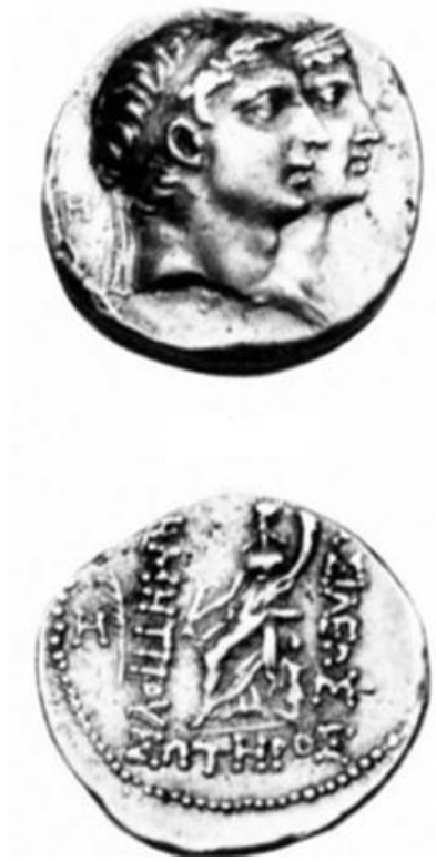
الشكل ١: مسكوكة الملك ديميتريوس و زوجته لاوديكي. (مأخوذة عن: Houghton, L., Seleucid Coins, Part II, vol.2, 2008, pl.16, fig. 1689.2).