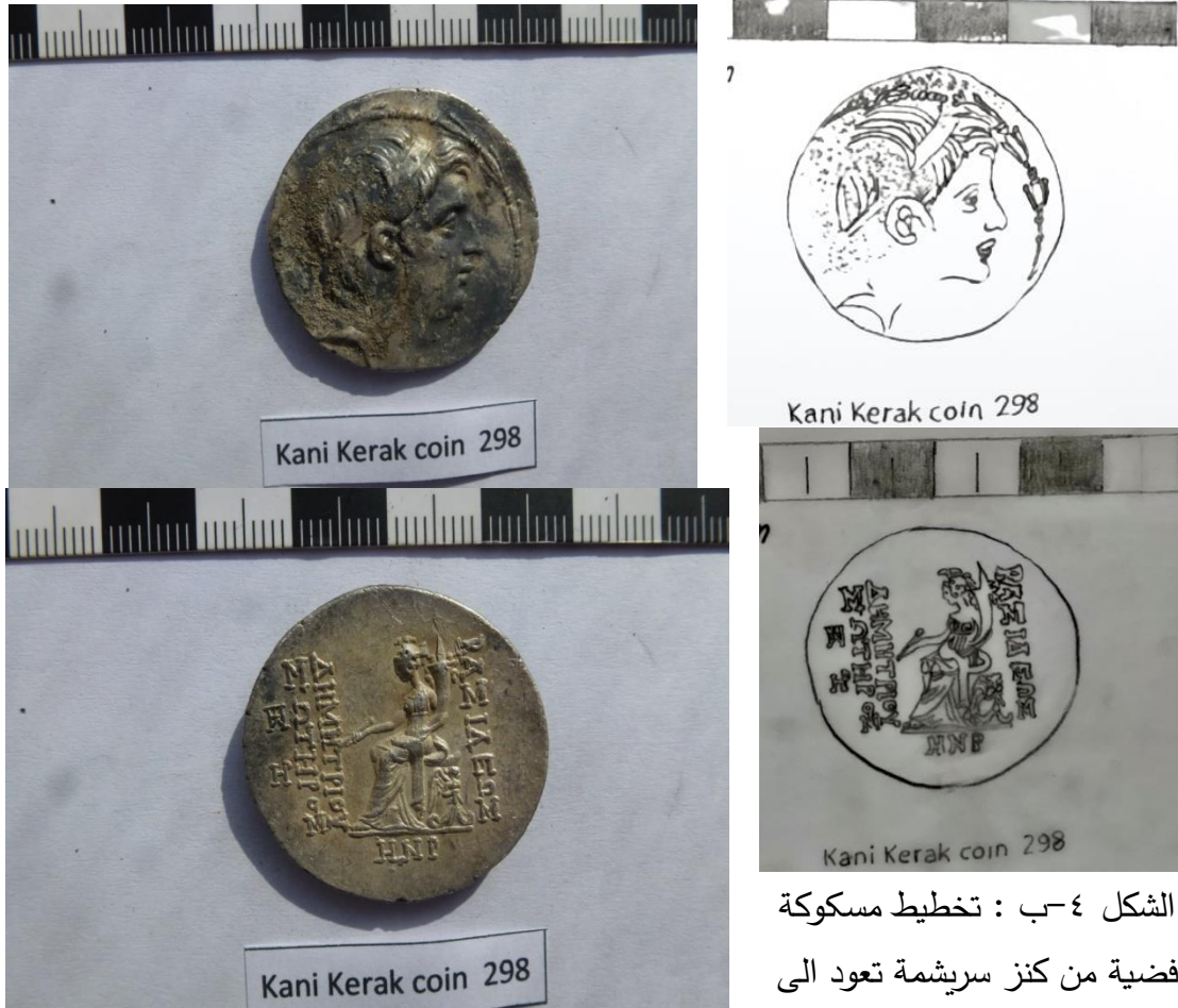
الشكل ٤-أ: مسكوكة فضية من كنز سریشمة تعود الى الملك ديميتريوس، مع لقب سوتر.