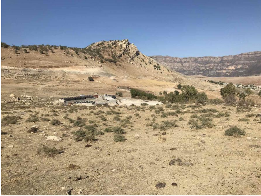
الشكل ٦: صورة توضح الموقع الذي تم فيه العثور على كنز المسكوكات.