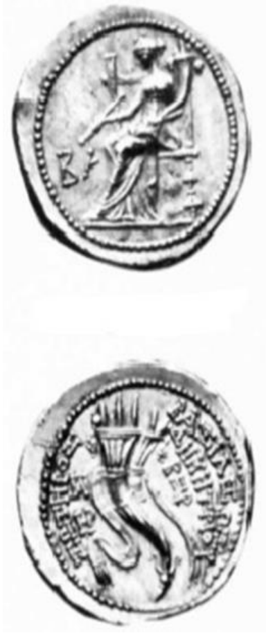
الشكل 2: مسكوكة الملك ديميتريوس، من نوع ضرب خاص، نرى على وجه المسكوكة الإلهة تايخي جالسة على عرشها، و نرى على ظهر المسكوكة قرن الخصب. (مأخوذة عن: Houghton, Ibid, Part II, vol.2, 2008, pl.13, fig.1630.2a-AV)