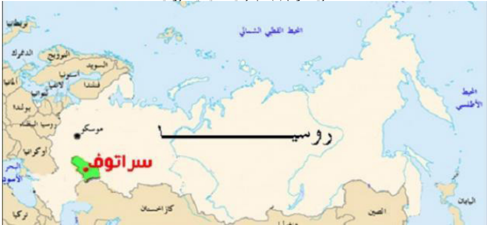
خريطة رقم (١) الجغرافية السياسة الروسية