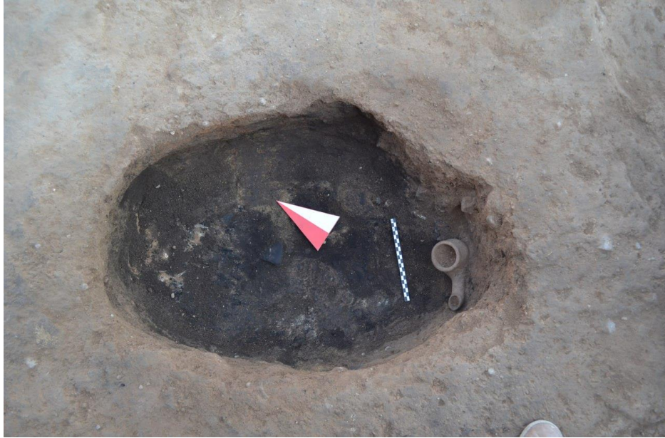
Fig. 2 – View from South-East of area A during the 2020 excavations.