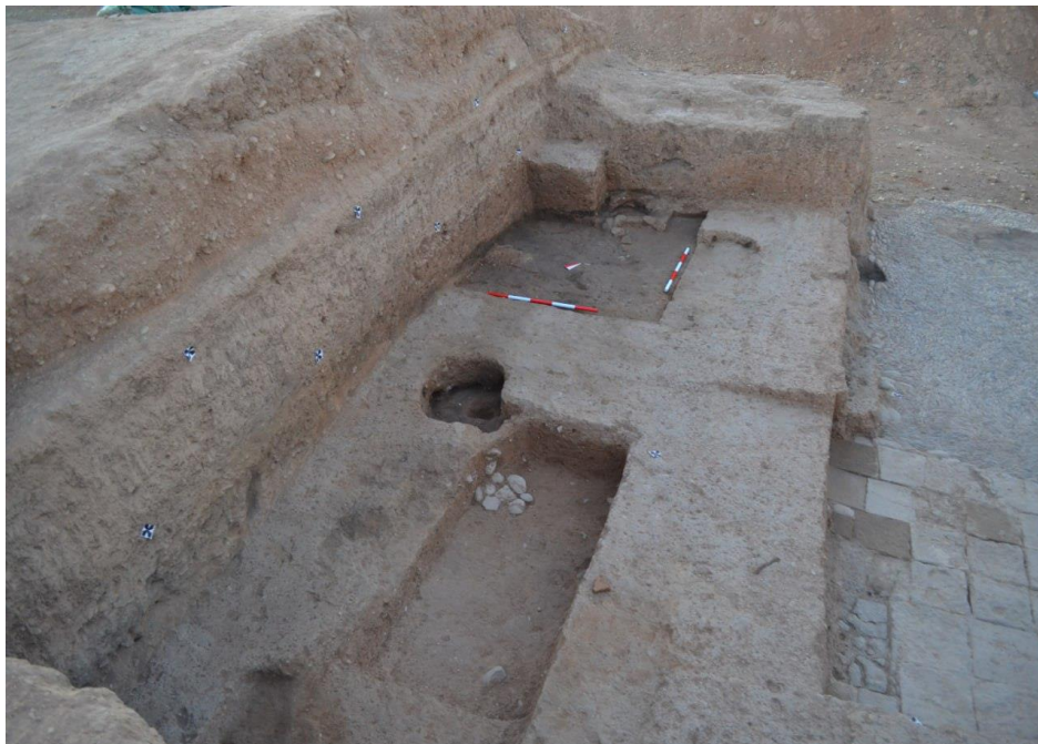
Fig. 3 – The votive pit P.1737+F.1738.