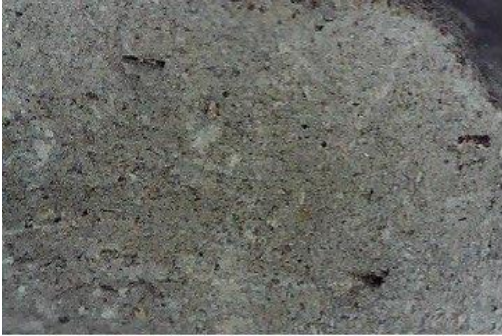
Fig. 6 – Close range photo of the fabric of lamp NE.20.P.156/1.