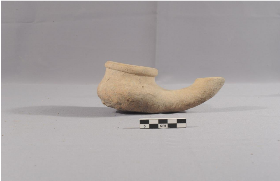
4 – Photo of lamp NE.20.P.156/1.