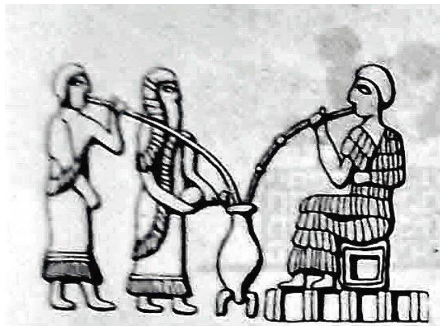
الشكل (٤) هونجز ، هنري ، التقنية في العالم القديم ، مصدر سابق ، ص ١١١ .