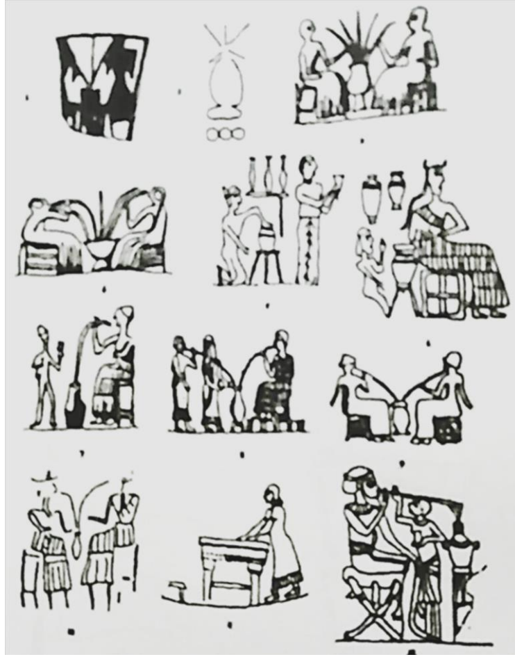
الشكل (١) عملية صنع الجعة منقوشة على الاختام الاسطوانية، نقلاً عن فاروق ناصر الراوي / حضارة العراق الجزء الثاني، مصدر سابق، ص ٣٤٩.