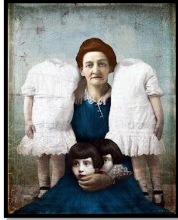
ان وايت بريطانيا

الافصح عنه من خلال التعبير الفني والعبور فوقه لانه يمثل شرا متصلا في الكثير من جوانب المجتمع لابد من التعايش معه .