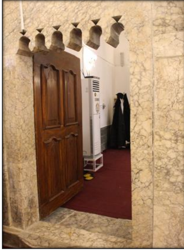
اللوح (١٠): مدخل قدس الاقداس الجانبي