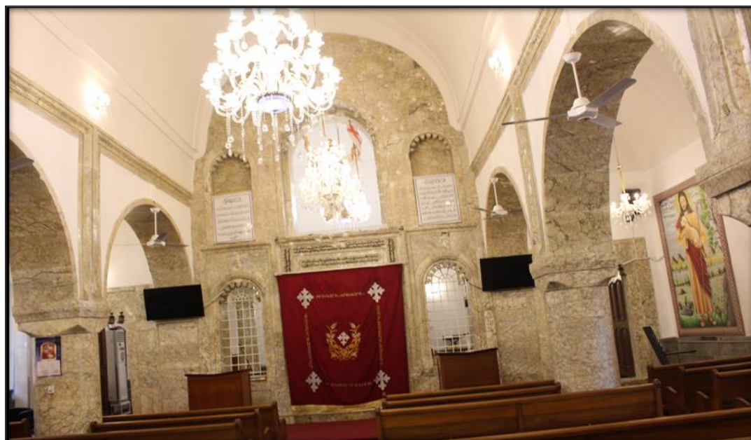
اللوحة (٩): المدخل الملكي يتوسط الرواق الوسطي وعلى جانبية النوافذ