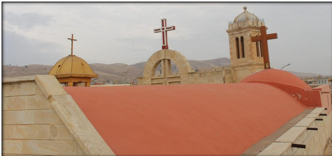
اللوحة (١٦): قبة وقبو كنيسة مارت شموني من الخارج