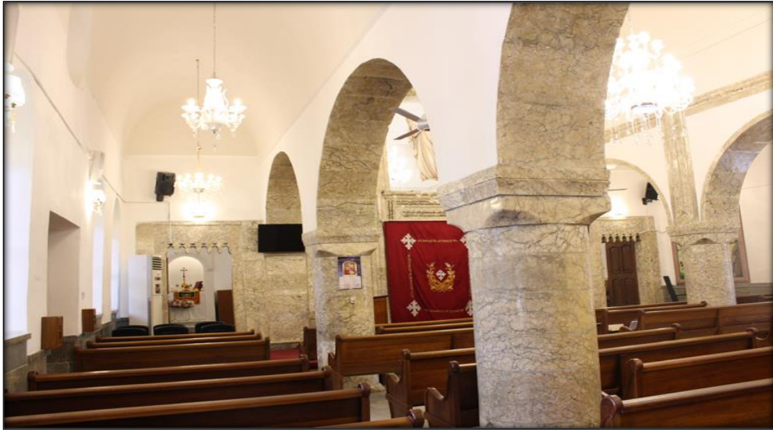
اللوح (١٢): قبو الرواق الجانبي الشمالي