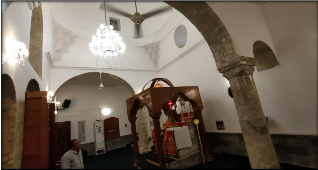
اللوح (١١): المذبح ونوافذ وحنايا وعقود قدس الاقداس