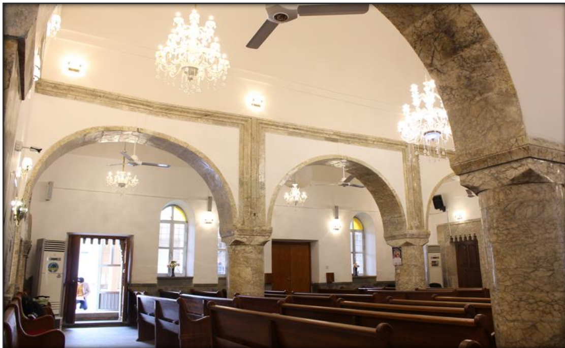
اللوحة (٨): عقود الهيكل يعلوها الافريز والنوافذ