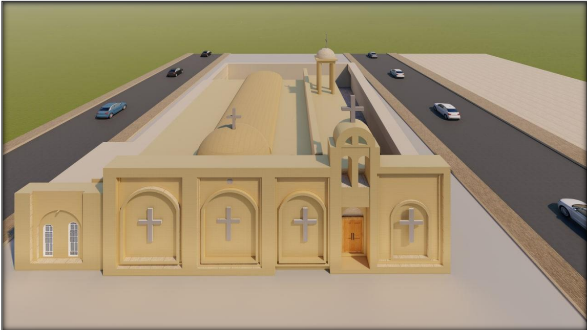
المخطط (٢): مخطط الواجهة الشرقية لكنيسة مارت شموني (رسم الباحث)