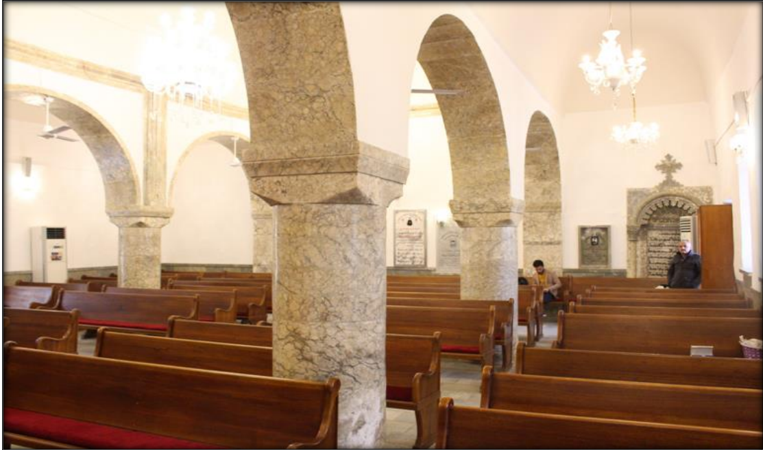
اللوحة (٧): اروقة وعقود واعمدة