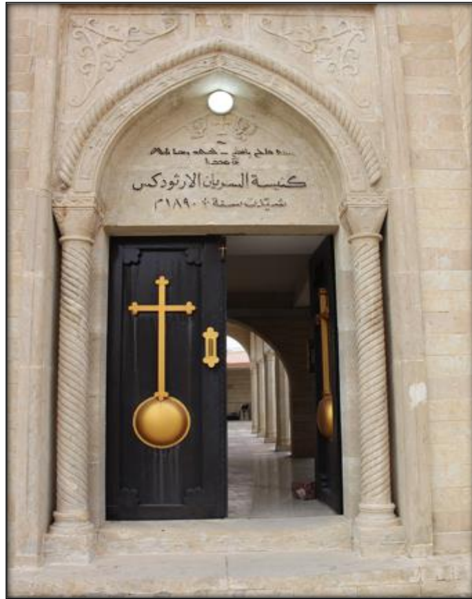
اللوح (٤): المدخل الرئيس في كنيسة مارت شموني تحف به الاعمدة