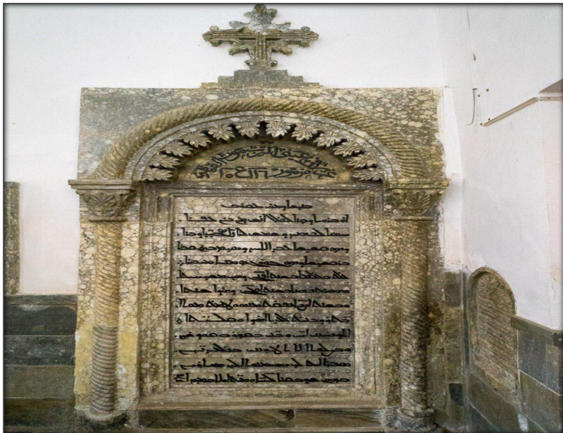
اللوح (١٣): شاهد قبر يضم كتابة عربية وسريانية