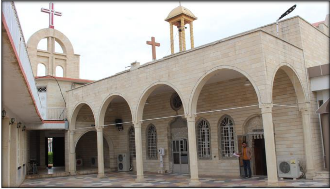
اللوح (٤) : عقود الدهليز والطارمة والمظلة على الساحة