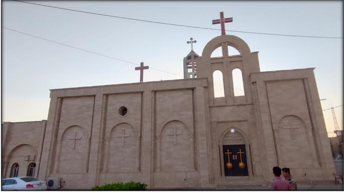
اللوح (٣):الواجهة الشرقية لكنيسة مارت شموني