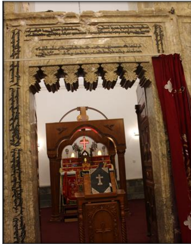
اللوحة (١٥): المدخل الوسطي (الملكي) تزيينة الدلايات