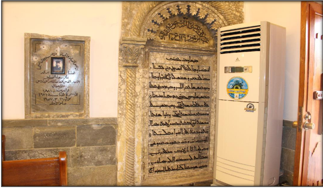
اللوحة (١٤): شاهد قبر ثاني في الجدار الغربي من الرواق الاول