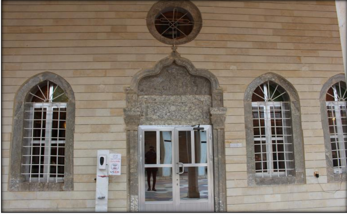
اللوحة (٦): مدخل هيكل الكنيسة الثاني والنوافذ التي تحف به