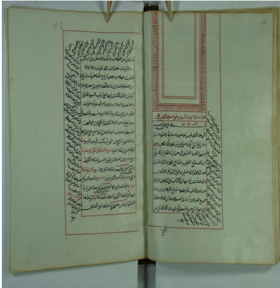
الصفحة الأولى من المخطوط