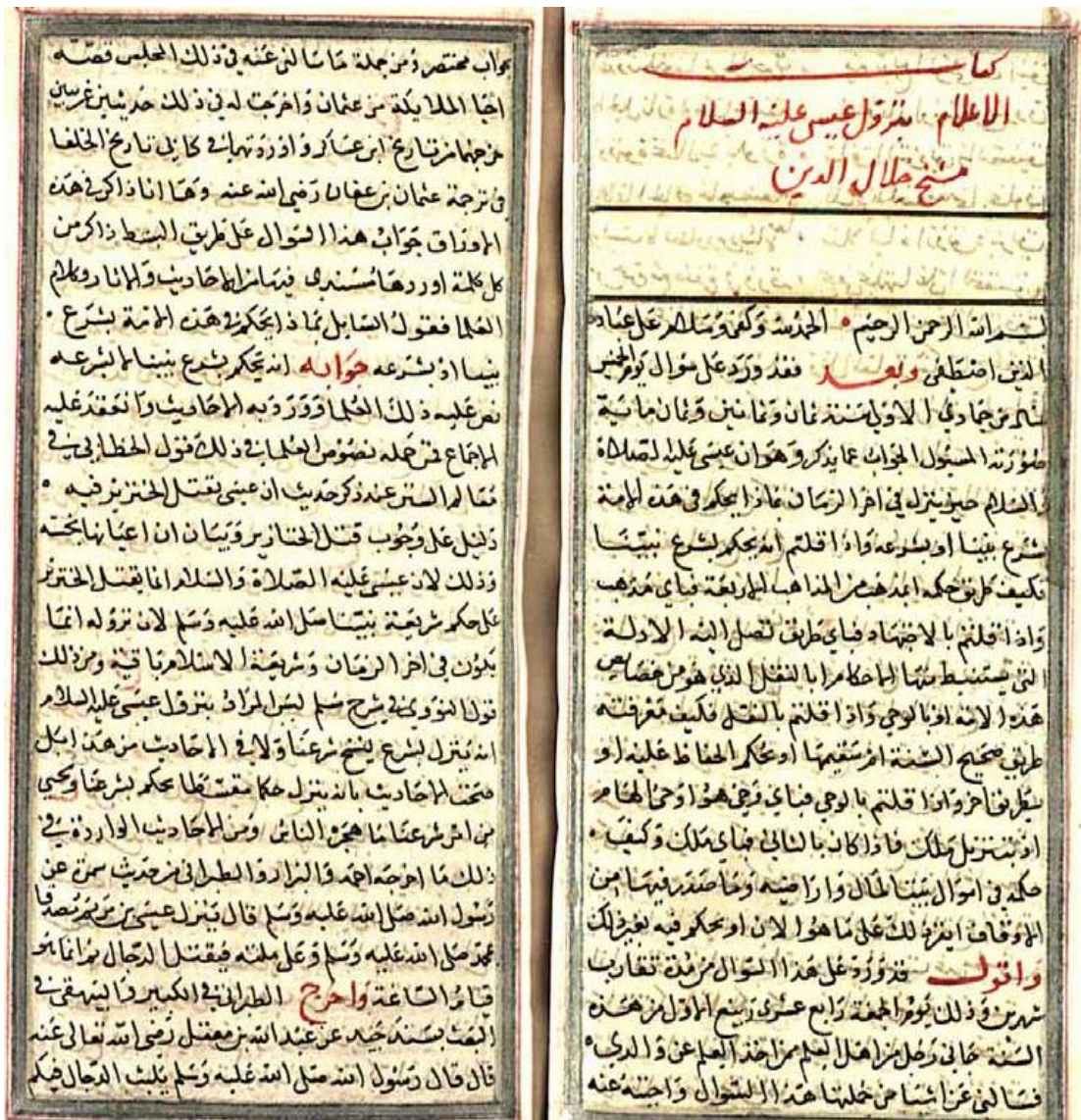
اللوحه الأولى من النسخة (أ)