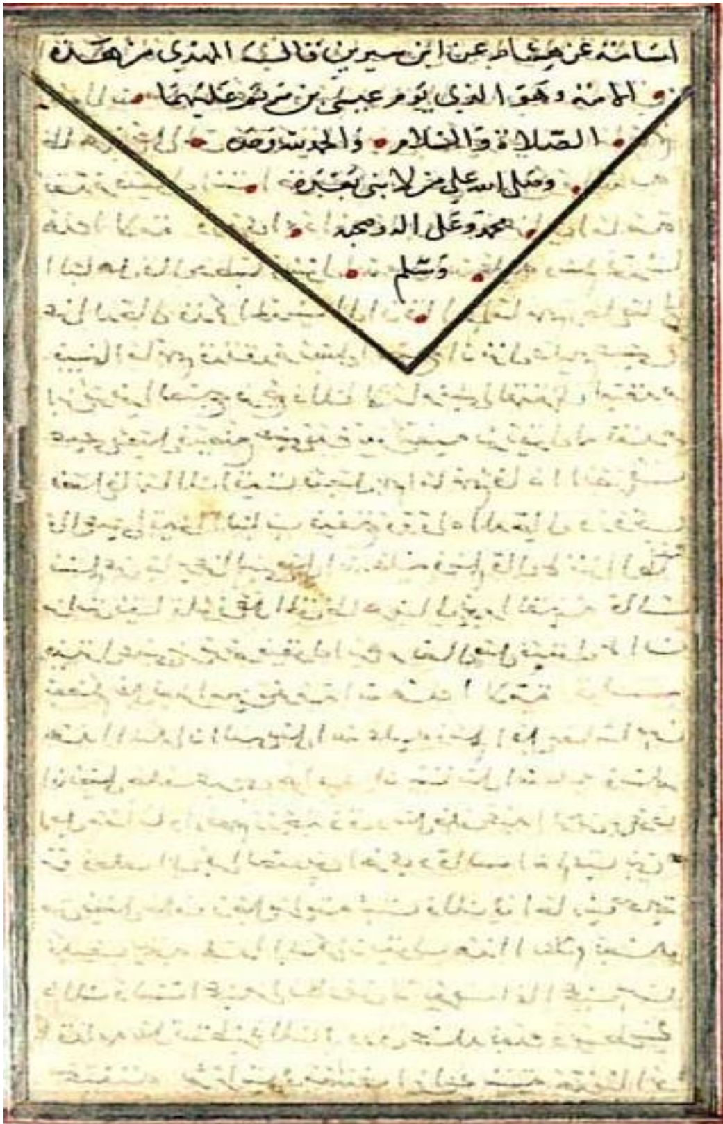
اللوحة الأخيرة من النسخة (أ)