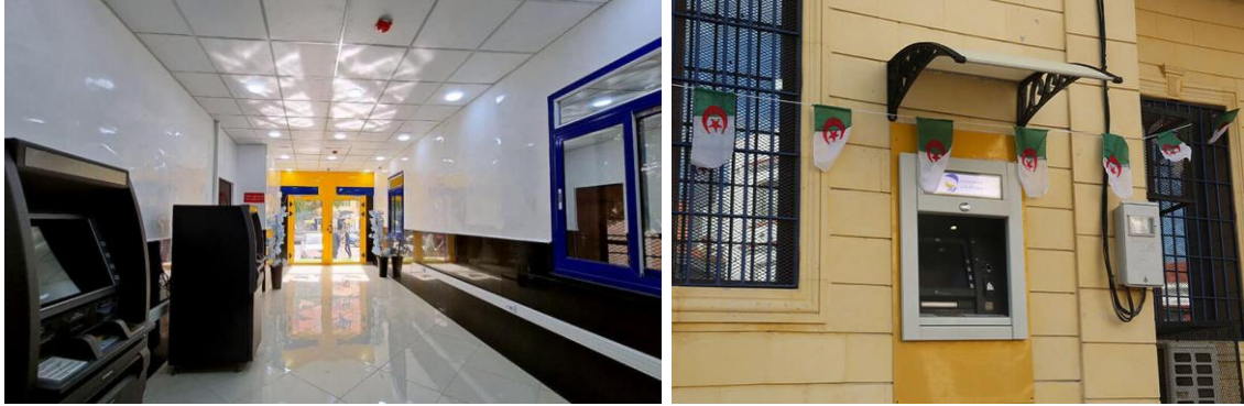
صورة توضح حظيرة الشبابيك الآلية للنقود

في إطار تنويع الخدمات التي يقدمها البريد، ومن أجل خلق خدمات ذات قيمة مضافة تسهم في تخفيف الضغط على المكاتب البريدية، يسعى القطاع إلى رفع عدد الشبابيك الآلية للنقود إلى أكثر من 3400 شباك مع نهاية سنة 2024. وفي هذا الشأن، فقد تم خلال سنة 2022، إطلاق مشروع اقتناء 600 شباك آلي للنقود، تم وضعها حيز الخدمة، ما يمثل زيادة بنسبة 42 بالمائة من العدد الإجمالي، وهو ما سمح بالانتقال إلى 1992 شباك نهاية شهر نوفمبر 2023، كما يجدر التنويه إلى أنه تم، إلى غاية نهاية شهر نوفمبر 2023، وضع 62 فضاء حر للخدمات حيز الخدمة مؤزعا عبر التراب الوطني، بما فيها الولايات العشر الجديدة، علما أنه في سنة 2020 لم يكن هناك أي فضاء بريدي حر في بلادنا. وتوضح المؤشرات والمعطيات السالفة الذكر النمو المتزايد لعدد الصرافات الآلية مما يؤكد على تطور البنية التحتية للقطاع في إطار الرقمنة وهو ما يسمح للزبائن بالحصول على الخدمات خارج أوقات العمل وفي الزمن المطلوب، كما يؤكد هذا المؤشر على تزايد عدد الخدمات البريدية المالية المقدمة وحجم الخدمات مما يؤكد رضا الزبائن بمستوى الخدمات المقدمة وكسب ثقتهم وهو ما يترجم تزايد حجم الزبائن والمعاملات البريدية المختلفة.