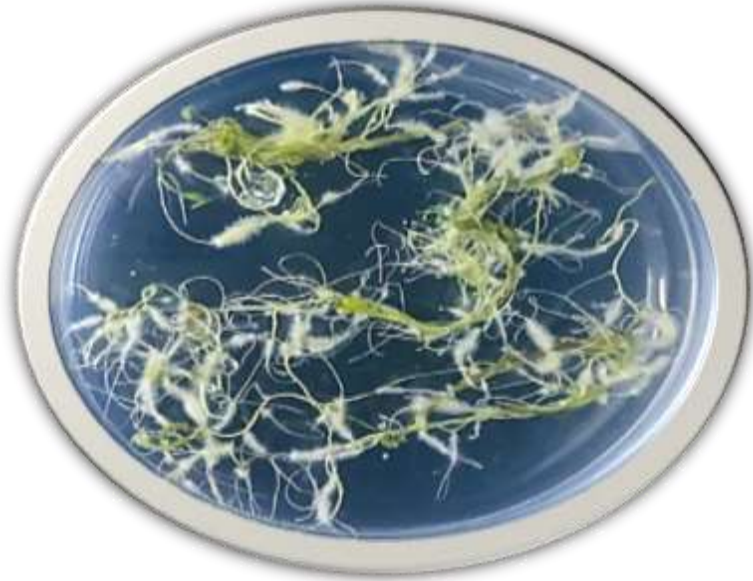
الشكل(2): إنتاج مزارع الجذور الشعرية المفصولة من قطع السيقان تحت الفلقية لبادرات البابونج Matricaria chamomilla L. الملقحة بتركيز 1214.32 نانوغرام مايكروليتر -1 بالنائل البلازميدي Ri لبكتريا A.rhizogenes ATCC15834 بعد 25 يوم.

نجحت الجذور الشعرية المتكونة على قطع السيقان تحت الفلقية نتيجة تلقحها بتركيز 1214.32 نانوغرام مايكروليتر -1 من بلازميدات Ri عند استئصالها ووضعها منفردة او بهيئة خصل على سطح وسط MS الصلب في استمرار نموها وزيادة تفرعاتها وسليبيتها للانتحاء الارضي وتكوينها مزارع من الجذور الشعرية والتي تطلبت اعادة زراعتها كل 25 يوماً.