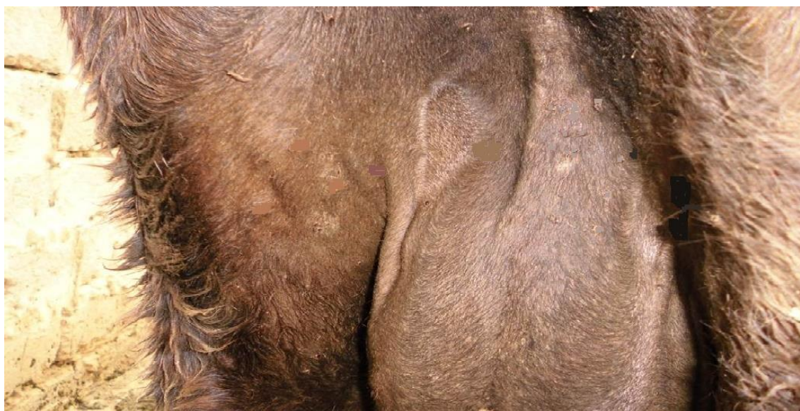
صورة (2) : الضرع بعد 24 ساعة من المعاملة بكريمات الزيوت مجتمعة