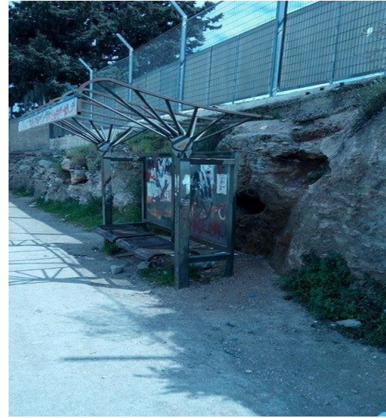
الصورة رقم (35) الساحات والميادين العامة.