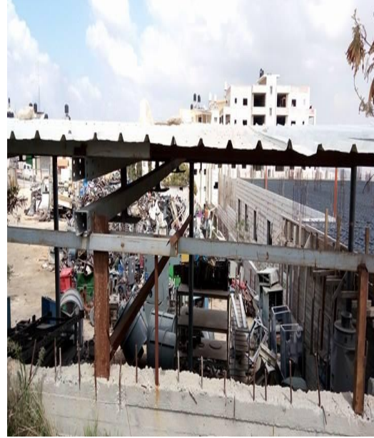
الصورة (40) تداخل استخدام الارض.