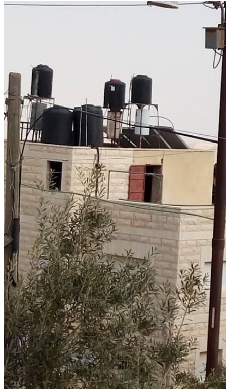
الصورة (7و6) الاستغلال الخاطئ لأسطح المساكن.