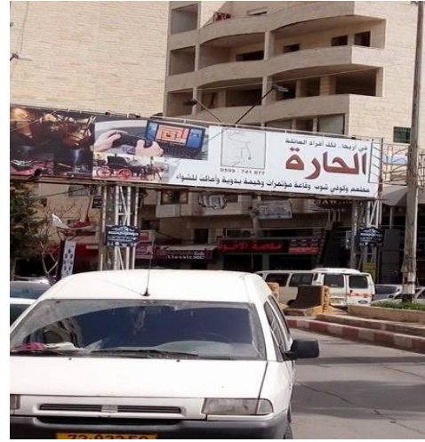
صورة (22) وسائل الدعاية والإعلان.