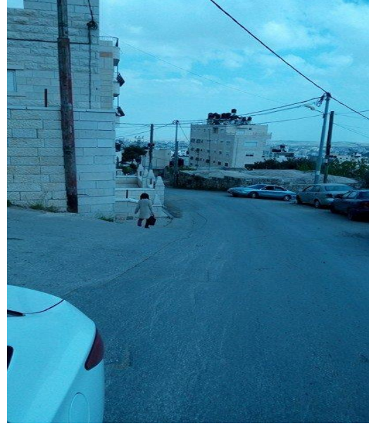
الصورة (42) عدم التقيد بالارتدادات القانونية.