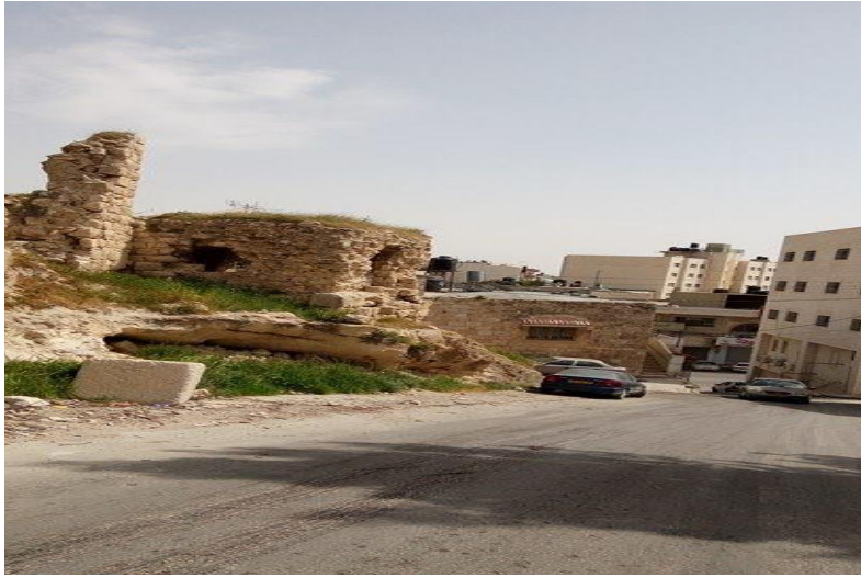
صورة (9) المباني الاثرية.

واضح على الرغم من عمليات الترميم لبعض هذه المباني، مما يتسبب في تلوث بصري بالإضافة إلى تحولها مكبات للنفايات وتحولها لمناطق تشكل خطر على المارة والسيارات والمسكن المحيطة بها، كما ان هذه المناطق تعاني من تلوث بصري يتمثل في احلال مباني جديدة بالمناطق الاثرية لا تتشابه في خصائصها بشيء لا بالشكل ولا بالتركيب كما في الصورة(9).