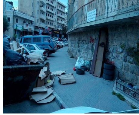
الصورة (27) انتشار مظاهر النفايات الصلبة. الصورة (28) انتشار مظاهر النفايات الصلبة.