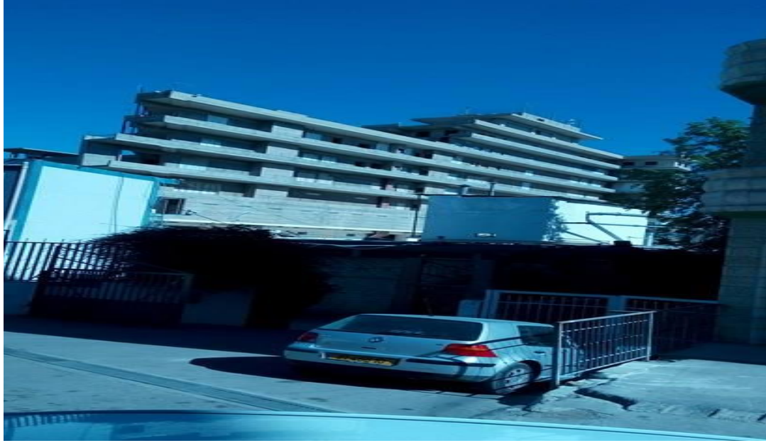
الصورة (11) الأبنية غير المكتملة البناء.