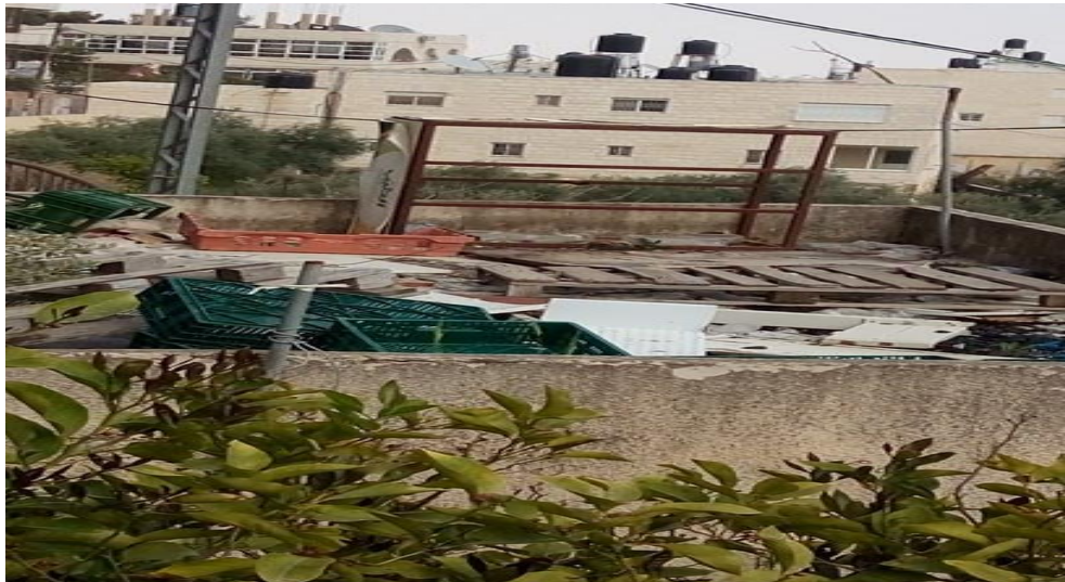
الصورة (8) الاستغلال الخاطئ لأسطح المساكن.