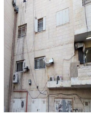
الصورة (36) اختلاف واجهات المباني. الصورة (37) مكيفات الهواء. الصورة (38) أجهزة الإرسال اللاسلكي.

سادساً- غياب عملية التخطيط الحضري: هناك عدة تعريفات لمفهوم التخطيط الحضري منها أنه عملية تشكيل للصورة المستقبلية للمدن من خلال تحديد المناطق المناسبة لإقامة المدن وامتدادها العمراني، ووضع الحلول المناسبة للمشكلات التي تواجهها، والتي تحتاج إلى إحداث عملية تغيير في خريطة استخدامات الأرض القائمة (19). إلا أن هذه العملية مغيبية في منطقة الدراسة ويشوبها القصور والعديد من التعديلات، التي أصبحت تعمل على تشكيل صورة التجمع العمراني بشكل يتسبب في تحولها لصورة ملوثة بصرياً، ويمكن توضيح ذلك من خلال: