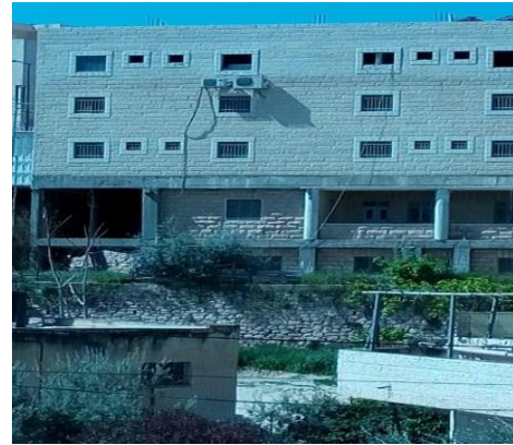
الصورة (4) التعديلات والإضافات على المباني. الصورة (5) التعديلات والإضافات على المباني.

3- الاستغلال الخاطئ لأجزاء المباني وأسطحها: يمكن رصد العديد من طرق الاستغلال الخاطئ لأسطح المباني والتي تشكل مظهراً من مظاهر التلوث البصري حيث لا يقف الأمر على التلوث البصري، وإنما يتعدى الأمر ذلك ففي كثير من الأحيان يتسبب هذا الاستغلال في زيادة المخاطر على السكان مما يحولها إلى مظهر من مظاهر انعدام الأمان في التجمع العمراني كما تظهره الصور (6 و7 و8).