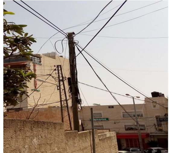
الصورة (32) تمديدات شبكتي الكهرباء والهاتف