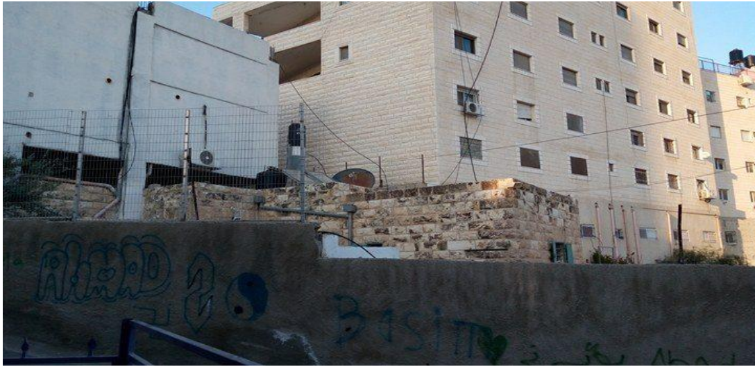
الصورة (2) اختلاف أشكال المباني نتيجة تعدد مادة البناء.