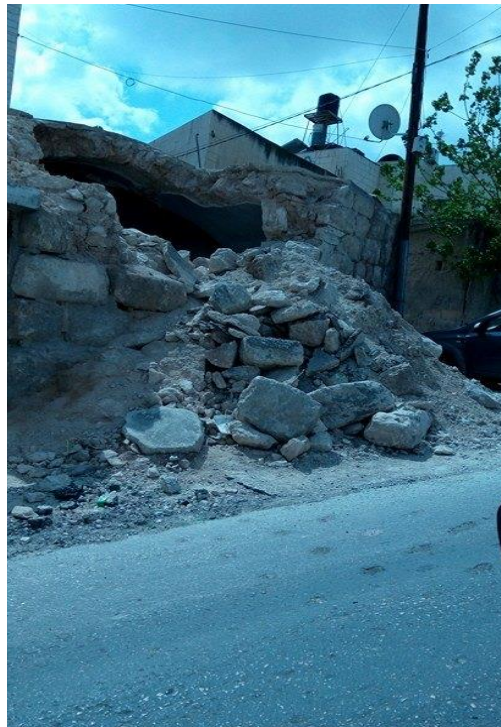
صور (12) المباني المهتمة و المتدهورة عمرانياً. صور (13) المباني المهتمة و المتدهورة عمرانياً.