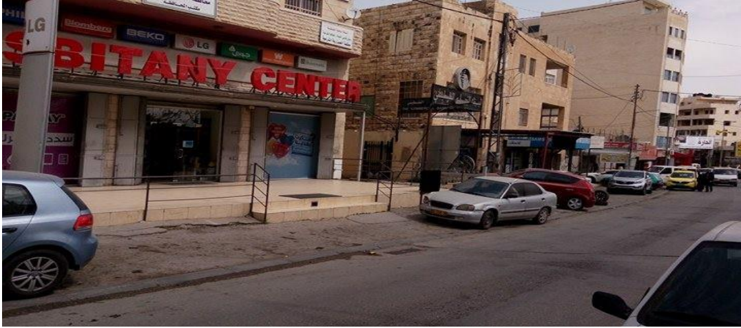
الصورة (3) اختلاف الطراز المعماري بين المباني.