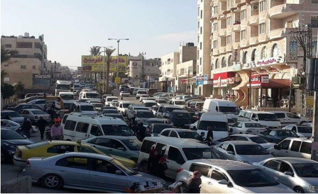
الصورة (14) الازدحام المروري في الطريق الرئيسي.

3- انتشار ظاهرة التجاوز التجاري على الأرصفة: تتركز هذه الظاهرة على جانبي الطريق الرئيسي لانتشار الاستخدام التجاري الطولي، وتتمثل هذه التجاوزات في إضافة أجزاء من البناء على الأرصفة، وإقامة البسطات التجارية، و عرض البضائع على الرصيف وتحويله كجزء من المحلات التجارية وفي بعض الأحيان يتم التجاوز بواسطة وسائل الدعاية والإعلان، عدا عن التلوث البصري الذي تحدثه هذه التجاوزات فإن لها انعكاسات سلبية يمكن استنباطها على النحو التالي: تعرض المارة إلى مخاطر جمة لاضطرارهم المشي على الشارع كما أنها تعيق مدى الرؤية للسائقين والمشاة ، بالإضافة لإعاقة الحركة في الطريق الرئيسي كونها تحتل حيزاً منه، وفي الوقت نفسه تقضي على امكانية الاستفادة من بعض الفراغات الموجودة أمام المحال التجارية والخدمات المنتشرة على الطريق الرئيس مما يدفع أصحاب السيارات بإيقافها في حرم الطريق الأمر الذي يضاعف مشكلة الازدحام المروري الخانق، ويمكن ارجاع الأسباب وراء هذه التعدييات إلى السلوك السلبي لبعض السكان وأصحاب المحال التجارية، وللأسف أصبح موضوع الاعتداء على الأرصفة يشهد تسابق محموم ومتزايد من قبل السكان والتجار، نظراً لعدم وجود اجراءات قانونية وتنظيمية رادعة كما هو موضح في الصور(15و16و17و18).