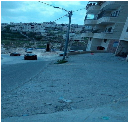
الصورة (33) تمديدات شبكتي الكهرباء والهاتف.

2- تمديدات شبكتي الكهرباء والهاتف: ان انتشار الكابلات والمحولات تمثل تلوثاً بصرياً جلياً وواضحاً في جميع المناطق بدون استثناء، وهذا الأمر قد يتسبب بحوادث تهدد السكان والممتلكات نظراً لقربها من المباني وامتدادها في كل مكان، وتزيد المخاطر أن بعض السكان يبنون بعض أجزاء مساكنهم بالقرب منها وفي كثير من الاحيان تمر هذه الكابلات من شرفات المساكن وبالنظر للصور (32 و33) رصد معالم هذه المظاهر.