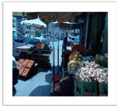
صورة (15) التجاوز التجاري على الطرق. صورة (16) التجاوز التجاري على الطرق