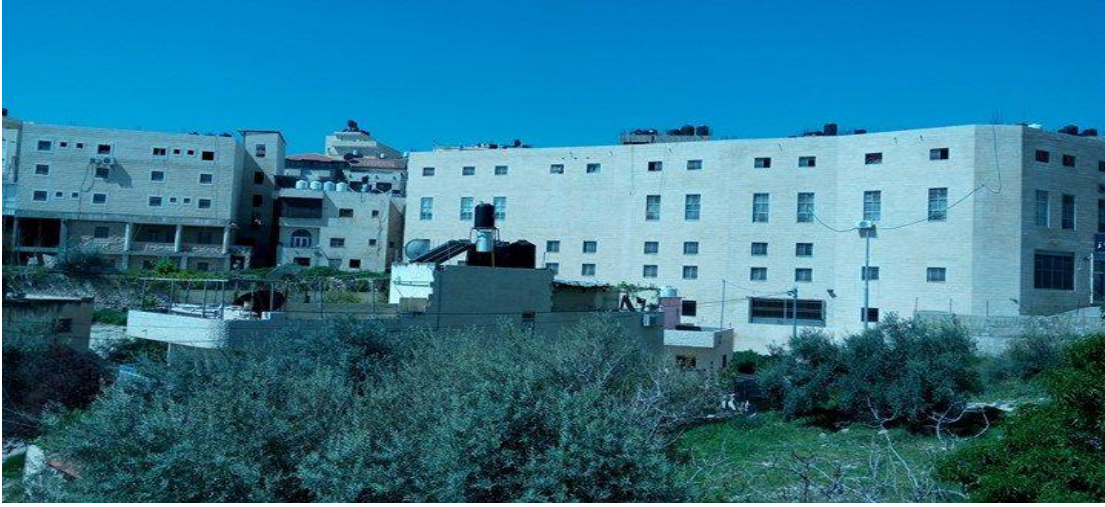
الصورة (1) تباين أحجام المباني.

لاستخدام ثلاثة مواد بناء هي: الحجر الأبيض والأصفر والاسمنت. كما توضح الصور (1 و2 و3).