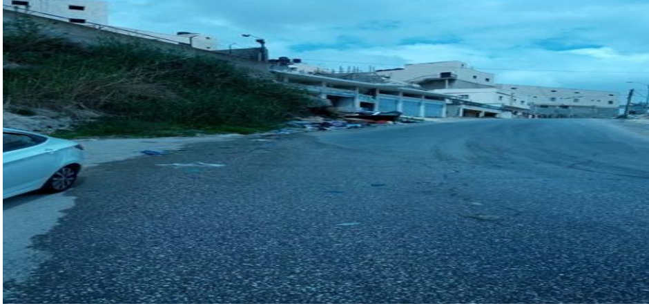
الصورة (31) مياه الصرف الصحي.

تتجمع على طول جريانها، وتزداد حدة هذه المشكلة في لجوء العديد من السكان على حفرها على جانب الطريق، أو أمام المنازل في الأرصفة أو تحتها، مما يعني تفاقم المشكلة في المستقبل القريب، والقضاء على أي إمكانية لتوسيع الطرق في المستقبل.