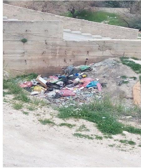
الصورة (29) انتشار مظاهر النفايات الصلبة. الصورة (30) انتشار مظاهر النفايات الصلبة.

رابعاً- المرافق والخدمات العامة: على الرغم من أهمية شبكات المرافق والخدمات في خدمة السكان إلا أن انعدام عملية تنظيمها وإحلالها في الأماكن المناسبة وكذلك صيانتها قد يتسبب في العديد من المظاهر التي من شأنها تحولها لمخلفات بصرية في التجمعات العمرانية التي تتواجد فيها، ويمكن تحديد هذه المظاهر على النحو التالي: