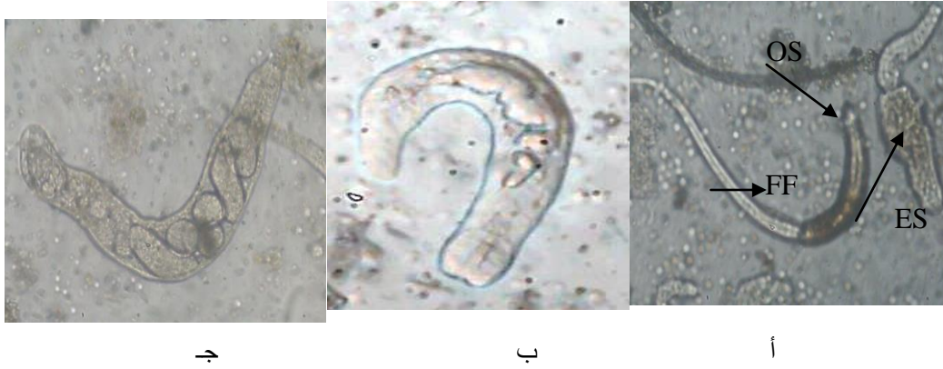
الشكل (1) المراحل اليرقية لأفراد المذنبت Cercaria 1 أ. اليرقات المذنبة Cercariae . ب. الريديا البنوية Daughter Redia . ج. الريديا الام Mother Redia .

قواقع Melanopsis sp. في ايران . و تشبه المذنبة ( Heterophyes sp. ) التي عزلت من قبل El-Gindy & Hanna (14) في قواقع Melania tuberculata و Pirenella conica في مصر ، و المذنبت التي عزلت من قبل Shamsuddin & Al-Adhami (15) من قواقع M. praemorsa و M. tuberculata في الموصل ، علما بأن عائلة Heterophyidae تضم انواعا تصيب الاسماك كمضيف وسطي ثاني و تصيب الطيور و اللبائن (ومن ضمنها الانسان) التي تتغذى على الاسماك المصابة مسببة مرض Heterophiasis ( 16 ) .