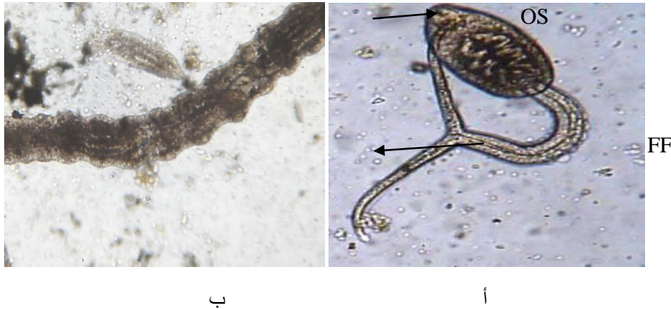
الشكل (2) المراحل اليرقية لأفراد المذنبت Cercaria 2 أ. اليرقة المذنبة Cercaria . ب. جزء من الكيس البوغي Sporocyst

2- Cercaria : الموضحة في الشكل (2) فتتميز بانها احادية الممص ( Monostome ) اي انها تمتلك ممصاً واحداً وهو الممص الفمي Oral sucker ، وتمتاز ايضا بانها مشطورة الذنب و شطرا الذنب Forkal rami اطول من ساق الذنب Tail stem ، وتمتاز بوجود الطية الزعنفية على الجانب الظهري و البطني Dorso-ventral finfold للذنب ، و تطابق هذه الصفات لمذنبت مجموعة Vivax cercariae من عائلة Cyathocotylidae Family التي عزلت من قواقع M. nodosa في ايران ، وتستطيع هذه المذنبت ان تصيب الاسماك كمضائف وسطية ثانوية ، و تصيب الطيور و اللبائن كمضائف نهائية (8) ،