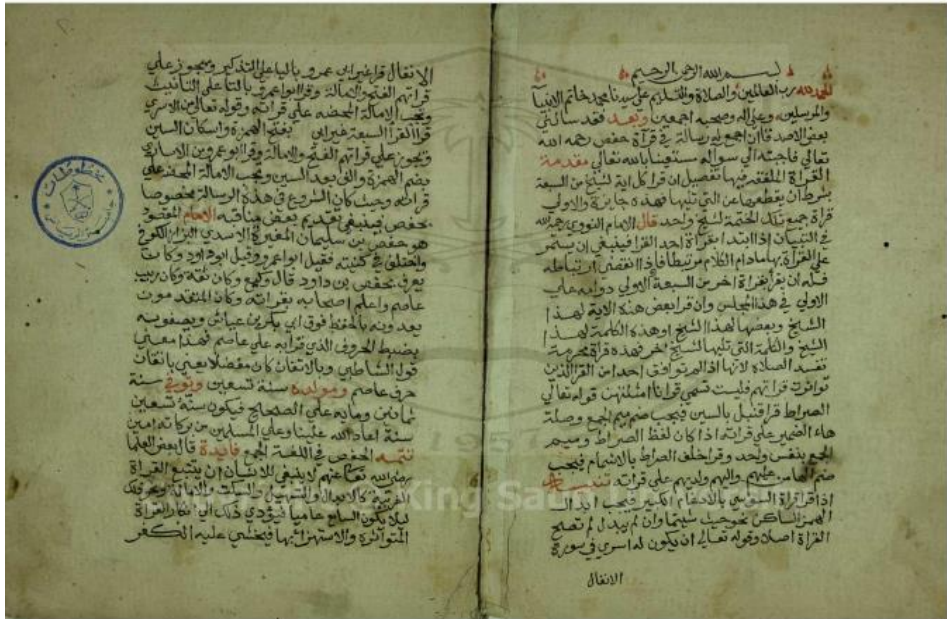
الصفحة الاولى من النسخة (أ)