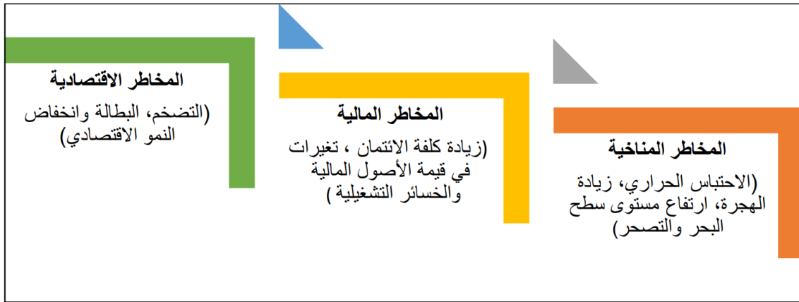
الشكل (2): العلاقة بين المخاطر المناخية والاقتصادية والمالية