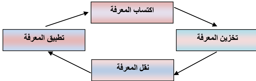
شكل (3) دوره إدارة المعرفة