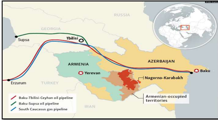
شكل (2): مسارات انابيب النفط والغاز التي تمر عبر أذربيجان

المصدر : Charles Recknagel , " Explainer: Why The Nagorno-Karabakh Crisis Matters " , April 05, 2016 , available at : https://2u.pw/ticqNbb