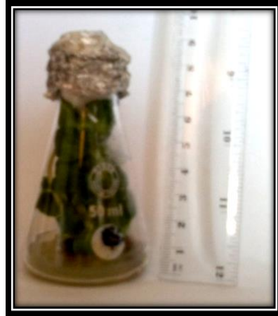
شكل(1): تضاعف زروعات نبات S. acmella بعد أربعة أسابيع من الزراعة في وسط MS حاوي على 1.0 ملغم/لتر من Kin. بالتداخل مع 0.1 ملغم/لتر من IAA مرحلة التجذير:

من بيانات الجدول 6 لوحظ وجود فروق بين مكونات الوسط الزراعي، إذ كانت أقل نسبة للبقاء بعد 4 أسابيع للنباتات المزروعة في الأوص الحاسوبية على تربة مزيجية فقط بلغت 65%، أما أعلى نسبة للبقاء بلغت 100% في الأوص الحاسوبية على الوسط الزراعي بتموس: تربة مزيجية بنسبة 1:1 (حجم:حجم) في حين كانت نسبة البقاء 83% في المزجة 0:1 و 88.88% في وسط الاقلمة 1:2 (حجم:حجم). تتفق هذه النتائج مع ما توصلت اليه الحسيني وآخرون [14] عند أقلمتهم لنبات الكيوي ( Actinidia deliciosa ) ومع بدر وآخرون [15] عند أقلمة نباتات الليمون المخرفش في ان الوسط الزراعي المتكون من بتموس: تربة مزيجية بنسبة 1:1 حقق أعلى نسبة نجاح في مرحلة الاقلمة في حين حصل Chaturvedi و Singh [16] أعلى نسبة نجاح لنباتات S. acmella بلغت 88.9% وذلك بعد