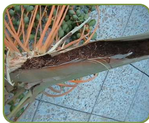
ضرر حشرة حفار عذق النخيل على عرجون عذق التمر