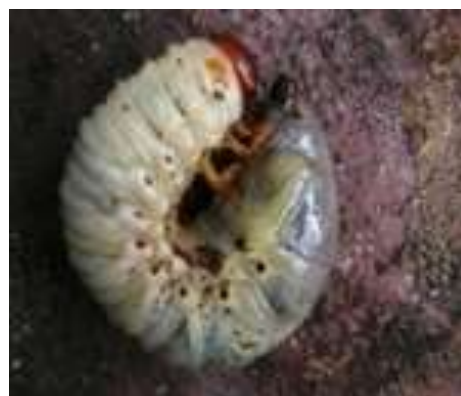
يرقة حفار عذق النخيل