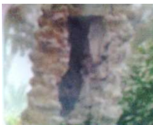
أضرار حشرات حفار عذق النخيل على جذع النخلة