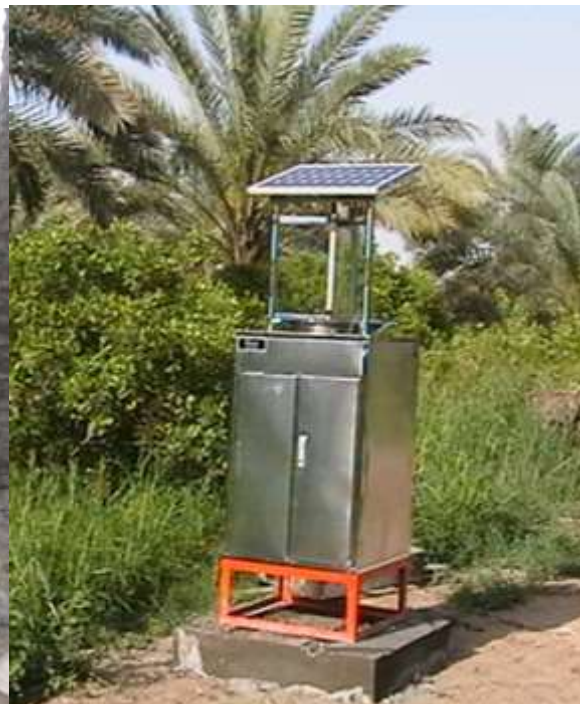
مصائد ضوئية تعمل بالطاقة الشمسية تستخدم لأغراض المراقبة والتحري والمكافحة لحفارات النخيل