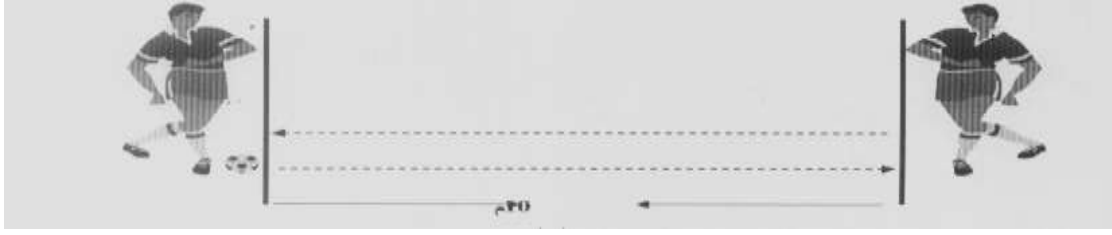
الشكل (٢) يوضح اختبار الأداء الفني لمهارة المناولة بكرة القدم