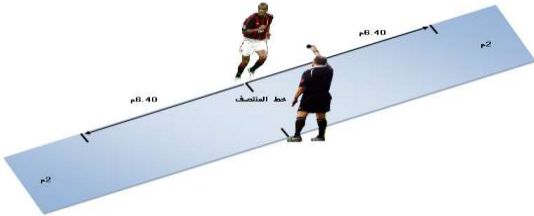
الشكل (١) يوضح اختبار نيلسون لقياس سرعة الاستجابة الحركية

ثانياً:- تحديد اختبارات مهارتي المناولة والتهديف بكرة القدم:- تم تحديد مهارتي المناولة والتهديف التي تعد إحدى مهارات المقرر الدراسي لمادة كرة القدم لطلاب الصف الثاني متوسط ، ولتحديد اختبارات مهارتي المناولة والتهديف بكرة القدم ، أعتمد الباحث الآتي:-