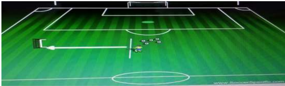
الشكل (٤) يوضح اختبار دقة المناولة بكرة القدم نحو هدف صغير يبعد مسافة (٢٠) متر

- الدرجة الكلية للاختبار (١٠) درجات ، كما هو موضح في الشكل (٤).