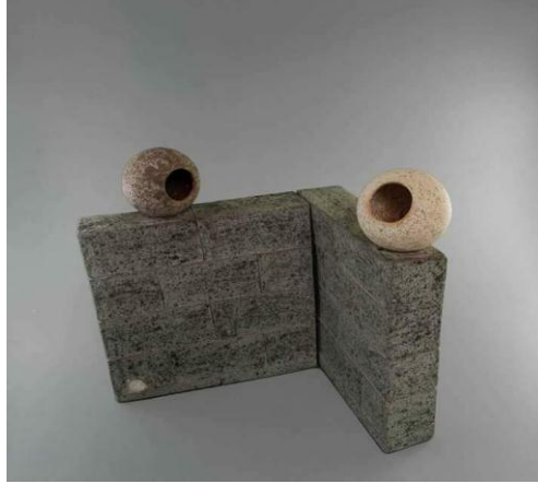
انموذج رقم (2)

لإيصال رسالة ثقافية خرجت من عمق ابداع الانسان وصلت لمرحلة تناقش ما يقدم عالميا فهو اهتم بالأشكال الهندسية فالرسالة التي وصلها في اعماله تجسد الحالات التي يعيشها الانسان كالقلق والترقب مع اصراره على إشاعة الحب والبحث عن الاستقرار .