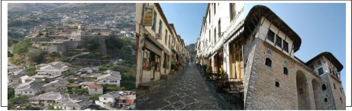
شكل [٢]: مشروع بلدة غجيروكاسترا، ألبانيا (جنوب شرق أوروبا)