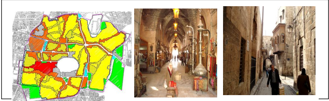
الشكل [٥]: مشروع احياء مدينة حلب القديمة