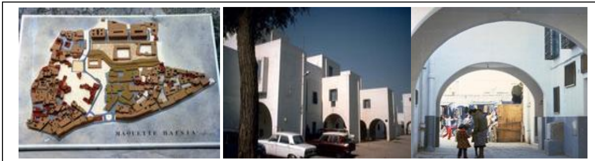
شكل [١]: مشروع حي الحفصية - مدينة تونس القديمة

المصدر: [اعداد الباحثة عن http://archnet.org/library/images ]