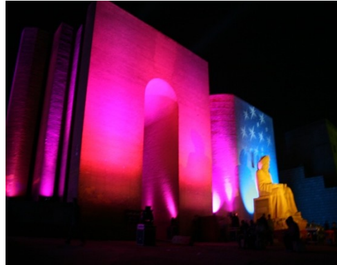
الصورة (٧): البوابة خلال إحتفالية عيد نوروز