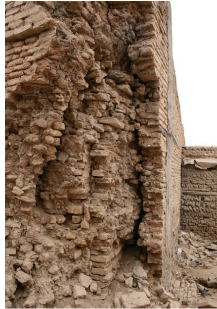
الصورة (٣): التهرؤ في الدور السكنية