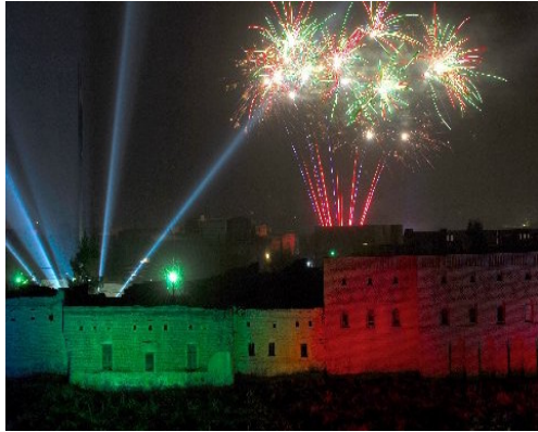
الصورة (٨): إحتفالية عيد نوروز في الموقع