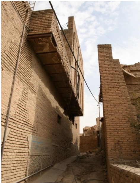
الصورة (٤): الحالة العمرانية لمحلة الطوبخانة