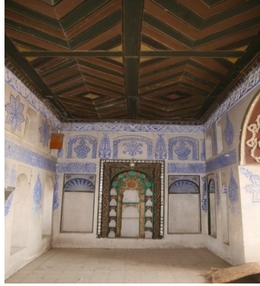
الصورة (٥) نماذج للدور ذات الزخارف والرسوم