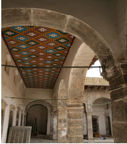
الصورة (٦): نماذج للدور ذات التيجان والرسوم