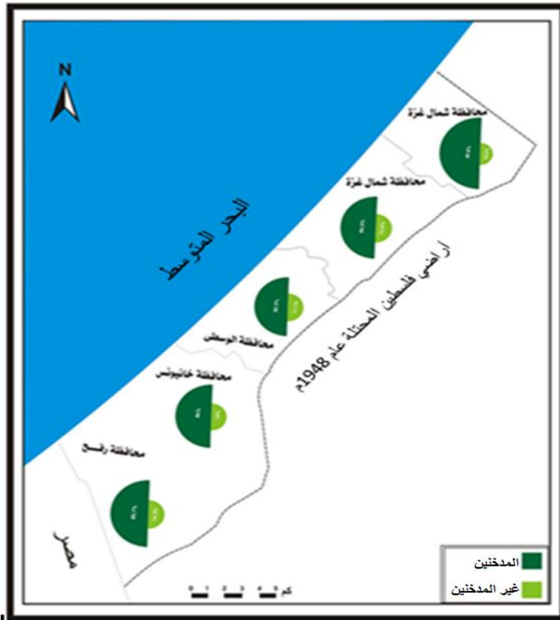
شكل (2) توزيع أفراد عينة الدراسة للذكور المدخنين في محافظات غزة

المصدر: هالة مدوخ ، مرضى الفشل الكلوي المزمن في محافظات غزة ، مصدر سابق ، ص(226) . ملخص اختبار مربع كاي (Chi-square) الذي فسر العلاقات بين التلوث الكيميائي للغذاء والإصابة بمرض الفشل الكلوي في محافظات غزة.