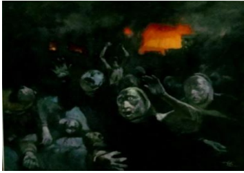
شكل (1) تل الزعتري الفنان /فائق حسن

الزعتري) عبر الفنان عن شراسة الحدث ومأساته على الإنسان العربي بالألوان التي استخدمها لتجسد صورة شبحية عن الشخوص لتجسيد الخوف والفرع المسبب للحدث ليكون هذا العمل مصدرا فضح السياسة التأميرية ضد الضحايا ، مجسدا فيها الحدث الإعلامي بالكشف عن التأويلات الرمزية التي تتلخص بالتفاصيل الواضحة في محاولة للتعبير الرافض للعنف بإظهار صورة الإنسان المقاوم للظلم والاضطهاد ولتعبير عن افكاره التي تجسدت في ابراز الشكل والمعنى برموزه ودلالاته الفكرية تاريخياً وسياسياً باتسام العمل الفني بطابع اعلامي و بشحنة اجتماعية ترفض التسلط للواقع المرير باحتجاج رافض لوحشية العدوان ( قاسم محسن،ص291) كما في الشكل(1)