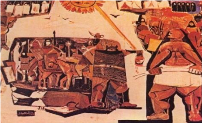
شكل (3) مصرع انسان الفنان/ كاظم حيدر

اما رسوم الفنان (كاظم حيدر) الذي عالج فكرة الخير والشر والمأساة التي تناول فيها ثورة الامام (الحسين) عليه السلام والتي تحمل اثاراً إعلامية في أبرز أعماله الفنية وسخر تجربته التعبيرية بأشكال تميل نحو التكعيبية وينحو في تركيبها منحى البناء في الخطوط المتعامدة على ابعاد المنظور، فالإنسان في معظم اعماله يأتي عبر تجسيد ديناميكية للحياة وقدرتها على التجدد والتطور، فلوحته (مصرع إنسان) التي تمثل رحلة الانسان في تحديه وثورته ضد الظلم من قبل السلطات الجائرة ( جبرا إبراهيم جبرا،ص 81) ، وفي ضوء ذلك استلهم الرموز القديمة وأعاد تكوينها بما يتناسب الفكرة والحدث ، فاستخدم السيف والخيمة والصحراء والحصان وغيرها، لكي يبين خطورة الحكم السلطوي الذي يفتك بالشعب ومنها نجد ان الفنان بين ملامح الرفض التي عبر فيها عن الصراع بين الخير والشر، وبذلك سجل معرضه الفني موقفاً لتاريخ الفن التشكيلي في العراق، بسبب الاسلوب الفني المتكامل تراثياً واثرائياً إعلامياً وفكرياً (بلاسم محمد،ص97). كما في الشكل (3)