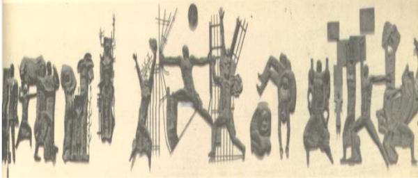
شكل (2) نصب الحرية الفنان /جواج سليم

عن المضامين الفكرية المطابقة لثورة 14 تموز عام 1958 ضد النظام الملكي آنذاك إذ حدث انقلاب للحكم من ملكي الى جمهوري ( عاصم عبد الأمير،ص78).