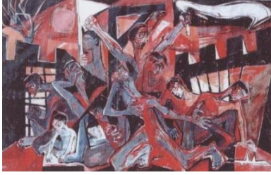
شكل (4) ثورة الجزائر الفنان/ محمود صبري