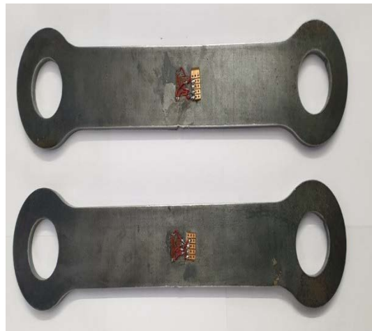
شكل (١) الجزء الاول من الجهاز المصنع.