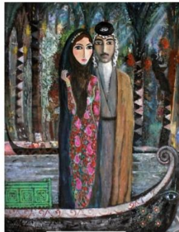
شكل رقم ٨