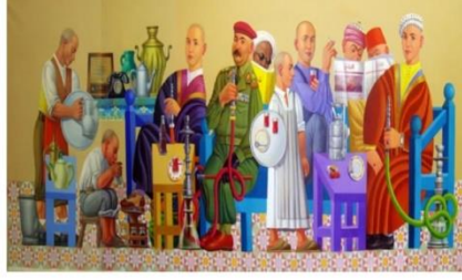
شكل رقم ٢