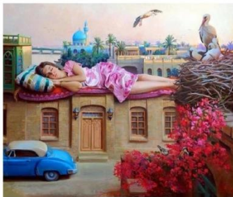
شكل رقم ١٢