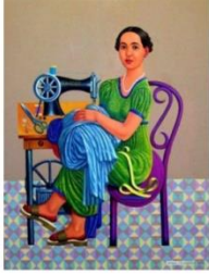
شكل رقم ٣