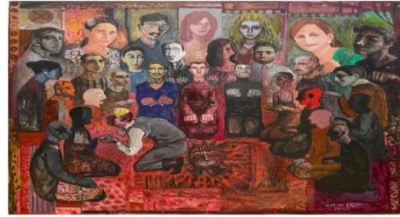
شكل رقم ٧