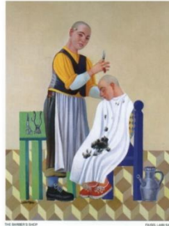
شكل رقم ٥