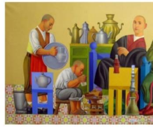
شكل رقم ١