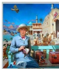
شكل رقم ١١