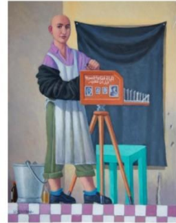
شكل رقم ٤