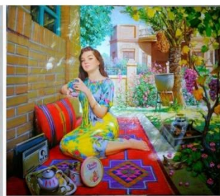
شكل رقم ١٠