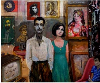
شكل رقم ٦