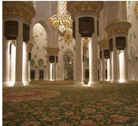
شكل رقم (15)