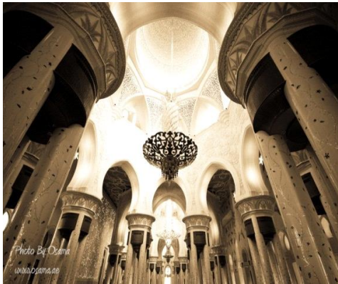
شكل رقم (18)