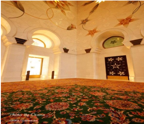
شكل رقم (16)