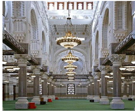
شكل رقم (9)