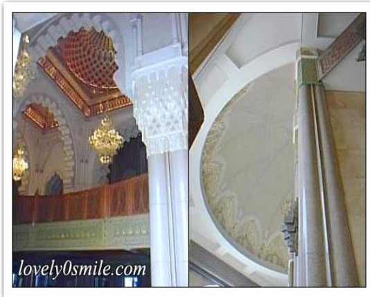
شكل رقم (12)