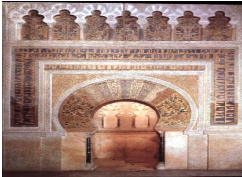
شكل رقم (10)