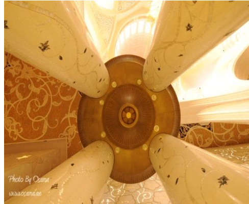
شكل رقم (17)