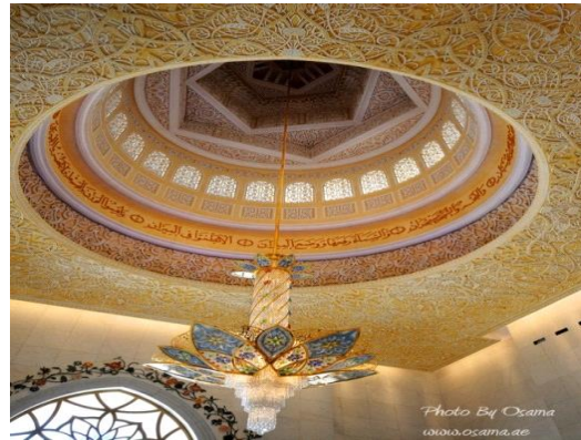
شكل رقم (13)