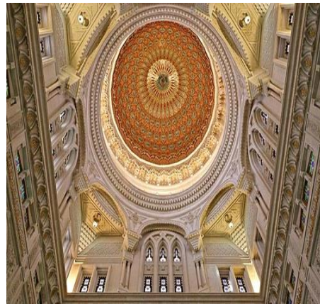
شكل رقم (11)

تحليل النموذج الثالث: الفضاءات الداخلية لمسجد (الشيخ زايد) - دبي - الامارات