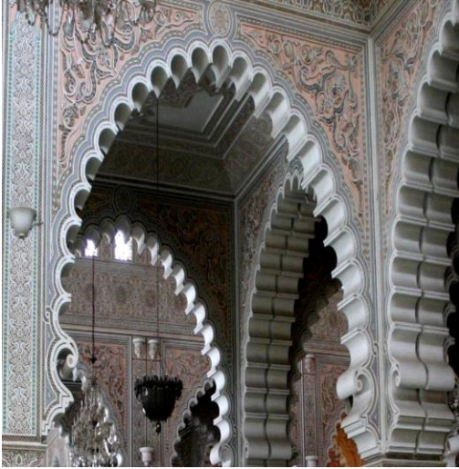
شكل رقم (8)

العقلي والذي يعتمد على الاثارة الذهنية والمعيار الحسي والذي يمثل الاحساس بالراحة ضمن التصميم الداخلي.