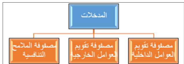
الشكل (٢) المدخلات.

وتسمى هذه المرحلة بمرحلة المدخلات؛ حيث تلخص الأدوات الثلاث معلومات المدخلات الأساسية المطلوبة؛ لإيجاد بدائل استراتيجية ملموسة، انظر الشكل ادناه.