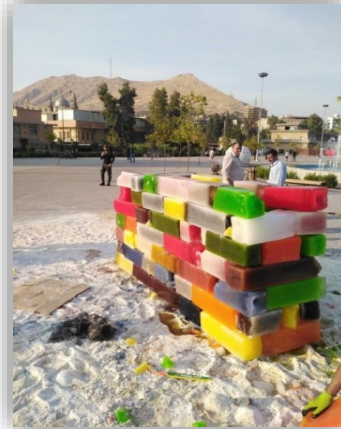
(شكل ٤) (شكل ٥)