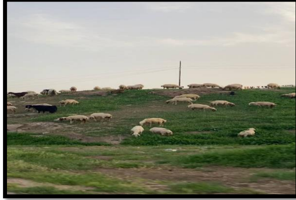
صورة (2) الثروة الحيوانية في مجمع البردية السكني.