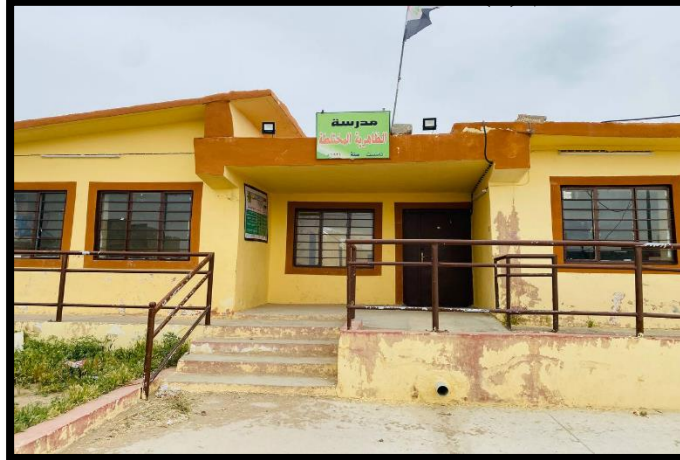
الصورة رقم (3) مدرسة الظاهرية الابتدائية المختلطة.

تقع هذه المدرسة شرق المجمع البردية السكني وتأسست هذه المدرسة عام (١٩٢٤)، ومن خلال الدراسة الميدانية وبشكل مباشر تم طرح أسئلة متعدّدة إلى مدير المدرسة وتبين أن هناك مشاكل متعدّدة، من ضمنها نقص في الكادر التدريسي ومشكلة نقص أعداد المقاعد الدراسية، ونقص في المناهج الدراسية. وتتكون مدرسة الظاهرية من (١٠) صفوف، وعدد الطلاب الذي يمارسون الدراسة فيها بحوالي (٢٢٠) طالب وطالبة. والكادر التدريسي فيها يتكون من (٨) معلمين، وهي تابعة إدارياً إلى محافظة نينوى.