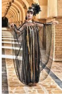
شكل رقم 3.9.2 زي هاشمي معاصر

هناك تحد كبير لتحديث الملابس النسائية الشعبية والتقليدية لمواكبة الموضة المعاصرة (الزيدي و كوزميجوف، 2018، صفحة 20) ومن خلال التحليل البصري وفق النظريات العلمية الحديثة لتحليل الأزياء يمكن إيجاد الفروق بين الأزياء التقليدية والحديثة (Delong, Marliyn، 1998، صفحة 26) كما يمكن تحديد المعلومات الفنية لتحليل نماذج الملابس والتي منها الميزة والأصالة والانتماء للأساليب العربية والأزياء المنتجة في زمن ما وكذلك الحلول التفصيلية وخصائص تقنيات الإنتاج (الزيدي و كوزميجوف، 2018، صفحة 34) ومن خلال الفروقات بين الزين التقليدي (شكل رقم 3.9.1) و (الشكل رقم 3.9.2) يمكن القول إن الزي الحديث قد أبتعد كثيراً عن الأصل رغم إحتفاضه بالشكل الشفاف وتغطية جميع الجسم الأ أنه تغير من ناحية تقنية الفصال وشكل الصورة الظلية وعرض فتحة الأكمام وهو ما يبعده عن الأصالة رغم بقاء إنتمائه للملابس العربية.