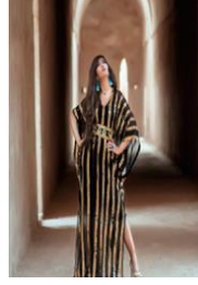
شكل رقم 3.6.2