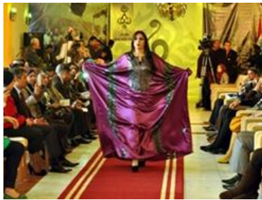
شكل رقم 3.8.2 هاشمي معاصر من عروض بغداد

شهد أسبوع الموضة العالمية في لندن عرض أزياء للمحجبات وكان ضمن العروض شكل الزي الهاشمي المعاصر والذي جاء بأكمام أقل عرضاً من التقليدية ووظفانة تحت الزي (شكل رقم 3.8.1) وهو ما يعد لإضافة جديدة للزي الهاشمي والذي ترك صدى واسعاً عند مهتمّي الأزياء الإسلامية حيق قالت المصممة رومانة بنت أبوبكر "السوق العالمي الأكثر نمواً في مجال الأزياء هو سوق الملابس الإسلامية". (العين، 2023) وهو ما يؤكد أهمية بحثنا في دراسة الملابس الشعبية العربية وتقديمها للعالم بصورة حديثة تضمن له الأنتشار العالمية. (والشكل رقم 3.8.2) يوضح الزي الهاشمي في أحد عروض الأزياء في بغداد وبين الشكل إن الزي الهاشمي جاء بقماش سميك لا يشف ماتحته وهو ما يخالف الأصل كون الزي الأصلي زي إحتفالي ألا انه بات في عروض الأزياء الحديثة يعرض كشكل لباس خارجي يلبس لمناسبات الخروج والسهرة (العرب، 2023).