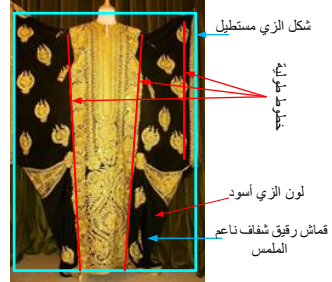
شكل رقم 3.5.1 تحليل الزي الهاشمي العراقي

وشكل الملابس مع التعديلات الضرورية لملائمة الزي للجسم (Delong , Marliyn, 1998). والشكل رقم 3.5.1 يمثل نموذج لتحليل الزي الهاشمي العراقي وفق منهجية مارلين ديونغ.