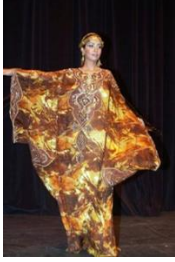
شكل رقم 3.6.4

المعاصر حيث استعيض عن الزخارف التقليدية بزخارف تراثية لصقت على الزي بطريقة تشابه الكولاج (شكل رقم 3.6.3). وكذلك الألوان أستخدمت تقنية جديدة في صبغ الزي المعاصر مثل ألوان الباتيك (شكل رقم 3.6.4).