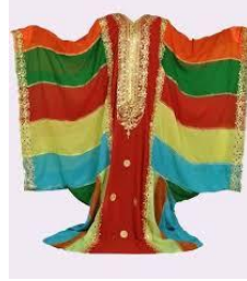
شكل رقم 3.7.2