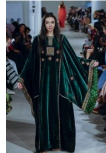
شكل رقم 3.8.1 هاشمي معاصر من عروض أسبوع لندن

https://al-ain.com/article/muslims-fashion-london