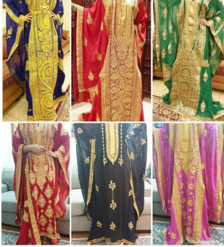
شكل رقم 2.9.1 نماذج لألوان مختلفة للزي الهاشمي