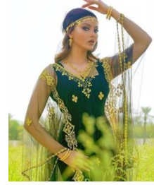
شكل رقم 3.6.1

https://ar-ar.facebook.com/ https://magazine.imn.iq https://ar.quoqa.com