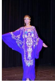
شكل رقم 3.6.3