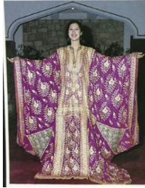
شكل رقم 3.7.3