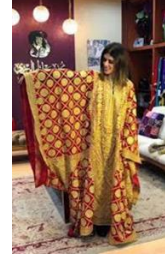
شكل رقم 3.7.1