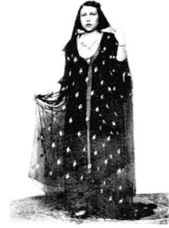
شكل رقم 3.9.1 زي هاشمي تقليدي