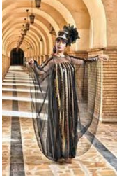
شكل رقم 3.7.4

رقم 3.7.3)، والمثير للأهتمام هو شكل الصورة الظلية للزي والتي تغيرت من الشكل المربع التقليدي الى شكل قوس دائرة مع أكمام مفتوحة بالكامل وهو ما يعد ثورة على التقليد المتوارث من الأجيال السابقة (شكل رقم 3.7.4).