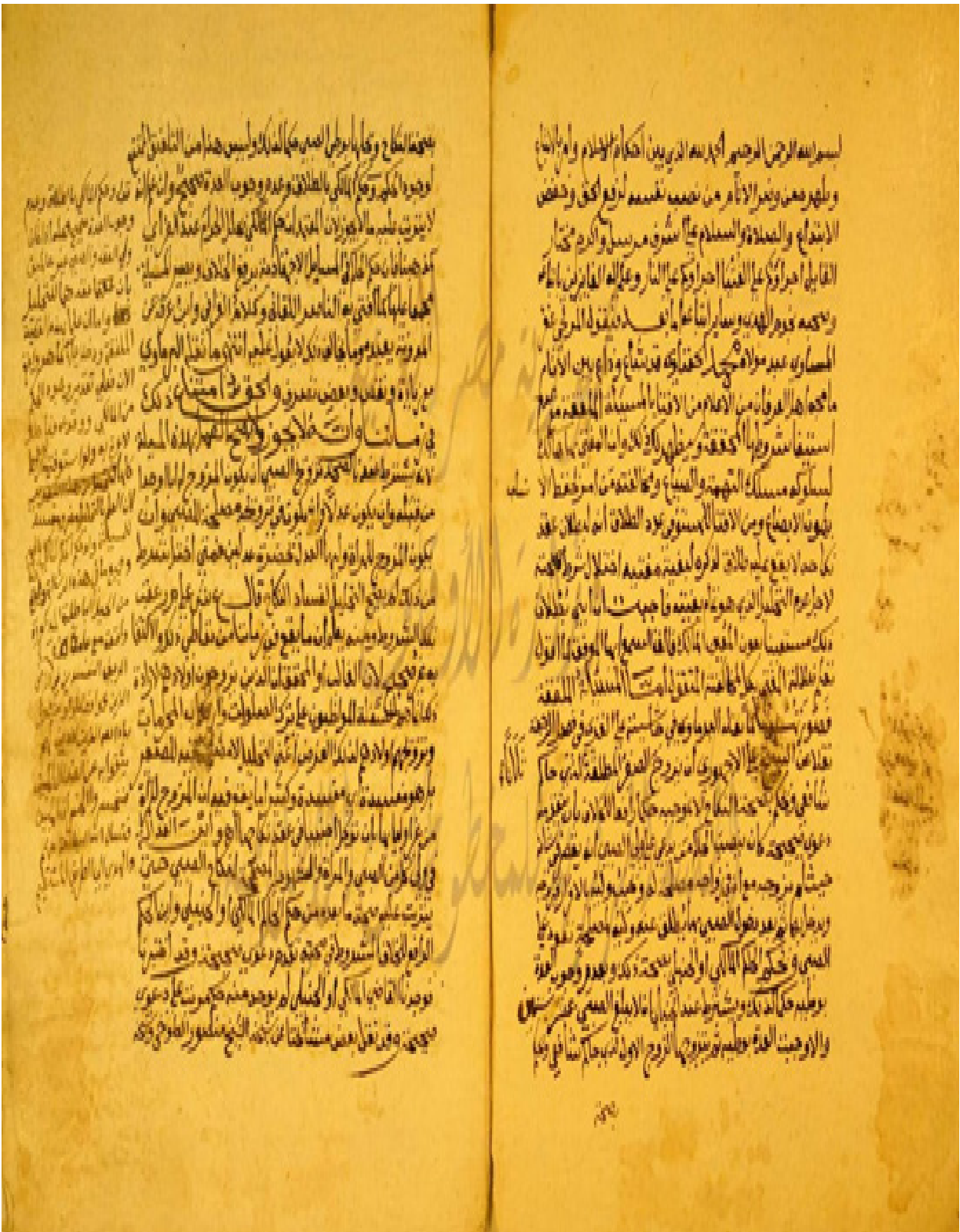
راموز الورقة الأولى من النسخة (ب)