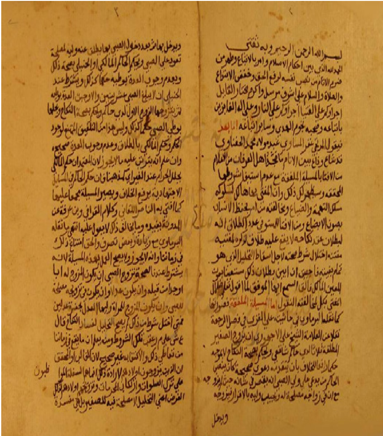
راموز الورقة الاولى من النسخة (أ)