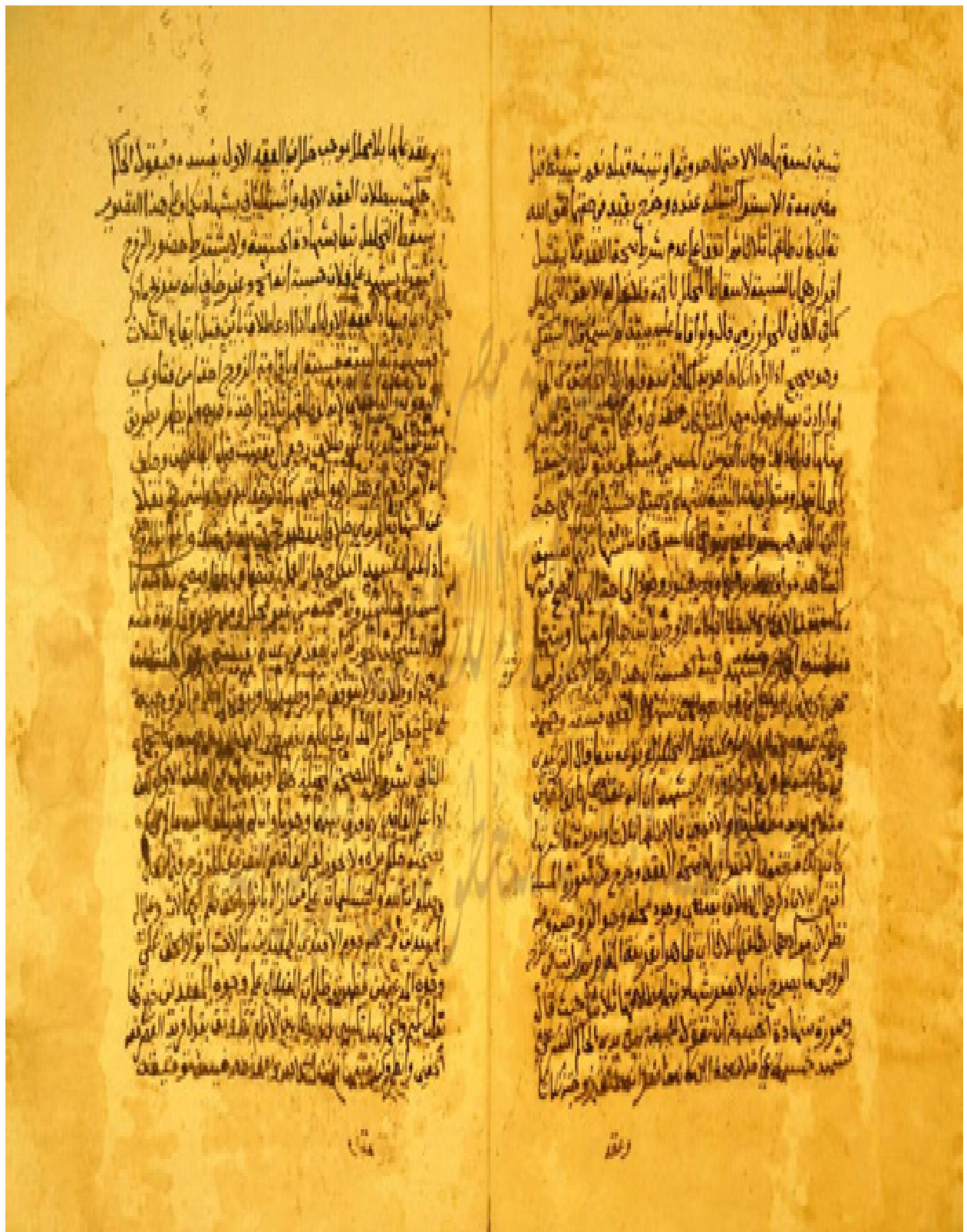
راموز الورقة الاخيرة من النسخة (ب)