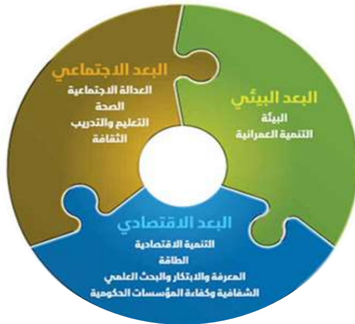
شكل رقم (١) ابعاد التنمية المستدامة