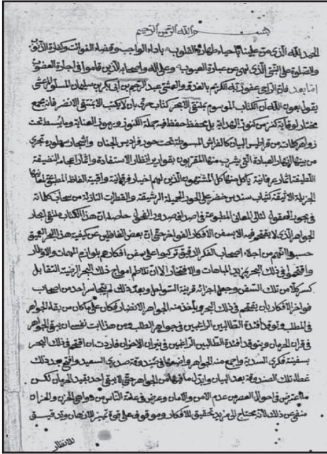
اللوحة الأولى من عملي من النسخة (أ) - (١٤٧ / أ)