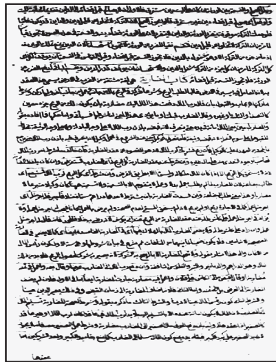
اللوحة الأخيرة من النسخة (أ)