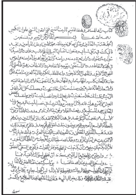
صفحة العنوان المزيّف للمخطوطة