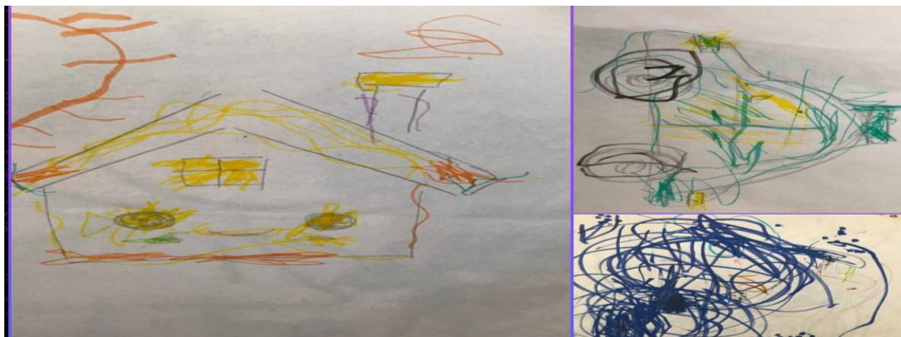
شكل (1) رسومات الحسن خلال الجلسات

الجلسة الرابعة: - نفذت 26-3-2025- الحسن -من خلال الملاحظة من قبلنا في هذه الجلسة، وجدنا ان الحسن اكثر انسجاما مع الفريق ويبدو عليه الهدوء وكان يلعب بالصلصال الملون المعد من قبلنا بشكل جيد.