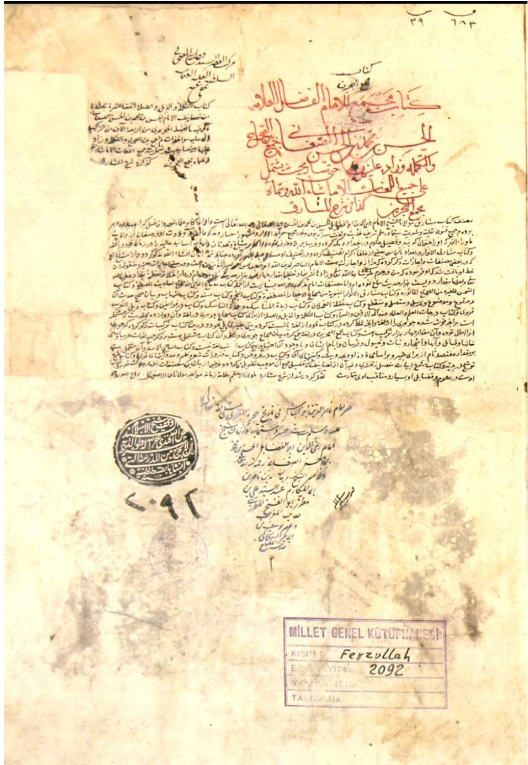
باب الطاء من نسخة مكتبة فيض الله أفندي