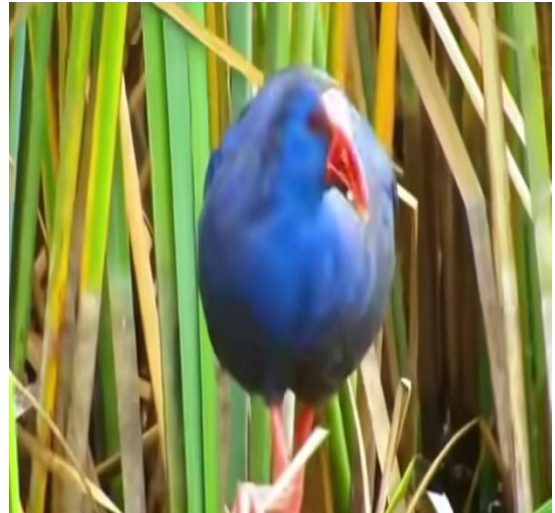
طائر البرهان الجميل