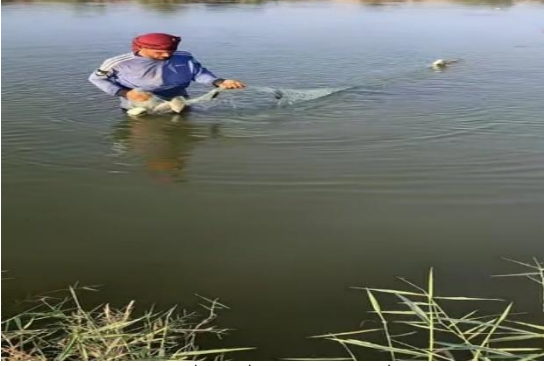
الصيد فارس جلوب الفرجاوي