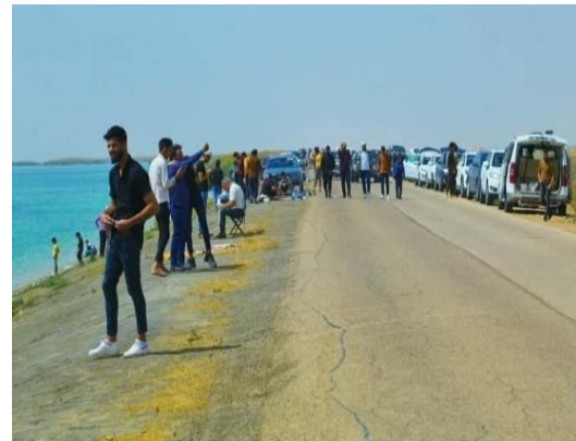
الباحث من منطقة الدراسة ٢٠٢٥/١/١