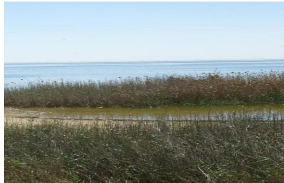
صورة رقم (١)