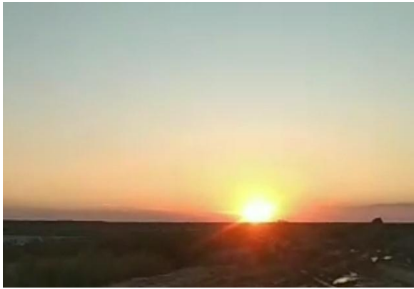
الباحث من منطقة الدراسة ٢٠٢٥/٢/٣

ومن خلال الدراسات الميدانية لاحظنا ان السائحون من مختلف المحافظات يأتون الى منطقة الدراسة لغرض الترفيه او الصيد او العمل وحسب المقابلات الشخصية نوضح في جدول رقم(١)