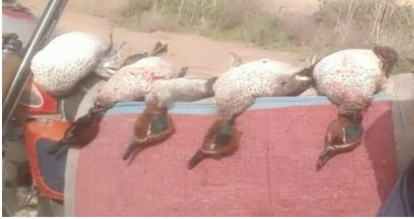
صورة تدل على الصيد الجائر من منطقة الدراسة