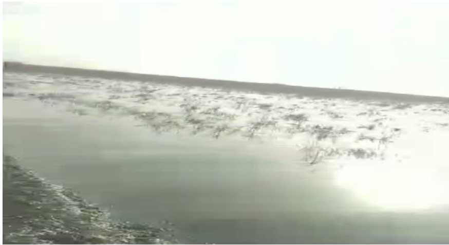
صورة من منطقة الدراسة تدل على انخفاض منسوب المياه ٢٠٢٥/٦/١٤

٢-التلوث البيئي : ان نقصان وتغير اعداد انواع النباتات والحيوانات المتواجدة في المنطقة سيؤثر من دون شك على التوازن البيئي مما يؤدي الى زيادة مطرده في افتقار بعض انواع من النباتات والحيوانات. التي لها دور في الحفاظ على التوازن البيئي