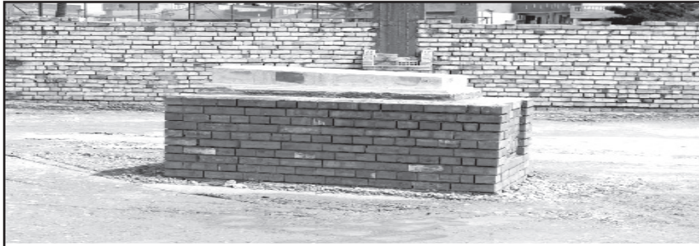
قبر الطّبري حاليًا في حديقة الرّحبي بالأعظمية