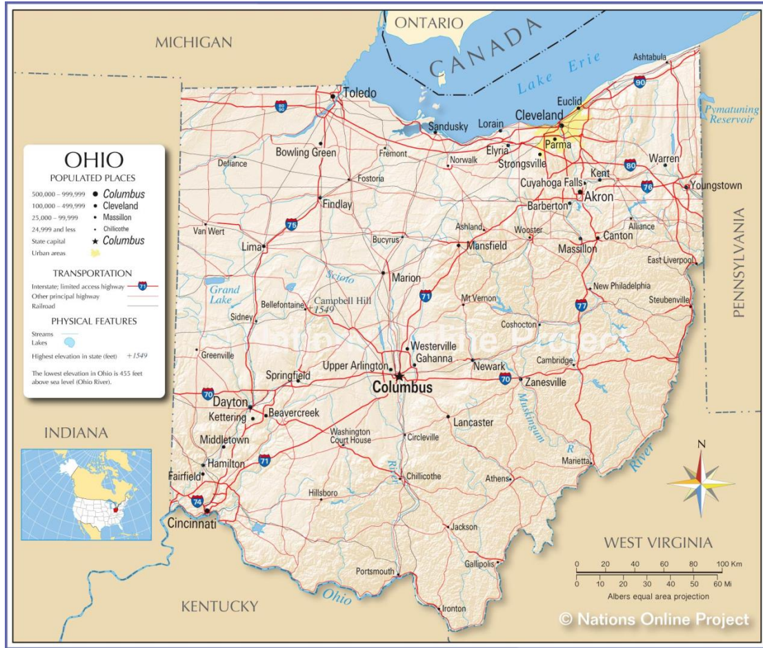
شكل رقم (1) يبين فيه خارطة وموقع ولاية اوهايو

لا يمكن فهم مجتمع الأميش في ولاية أوهايو من دون التوقف عند الفضاء الجغرافي الذي يحتضن وجودهم، فالمكان بالنسبة للأميش ليس مجرد مساحة فيزيائية، بل بنية رمزية-دينية تتفاعل فيها الأرض والإنسان والإيمان ضمن نظام متكامل من المعاني والعلاقات، إن الجغرافيا الأميشية ليست محايدة، بل مشحونة بقيم التواضع والبساطة والانعزال، ما يجعلها نموذجاً لما يسميه الأنثروبولوجي الفرنسي مارسيل موس بـ"الكلية الاجتماعية"، أي اندماج الجغرافيا في النسيج الاجتماعي والثقافي والروحي للجماعة، في أوهايو تحديداً، حيث توجد أكبر التجمعات الأميشية في العالم، تحوّل المكان إلى هوية معاشة، تُعيد إنتاج ذاتها عبر المزرعة، الطريق، البيت، والكنيسة إن المكان هنا ليس إطاراً للسكن فقط، بل وسيط أنثروبولوجي يعكس طريقة الأميش في رؤية الكون وتنظيم الوجود.