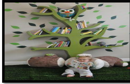
شكل (١٩) // مكتبة مصممة وفق الإستعارة الشكلية للأشجار

عمل المصمم الصناعي على توظيف مجموعة من الخصائص أو السمات الشكلية الخاصة (بالنباتات) ، وعادة ما يكون الجذب عن طريق توظيف الشكل المألوف لدى الطفل بطريقة جديدة تبعد الملل عن الطفل ، لذا لا بد للمصمم من إعداد تخطيط مسبق يتضمن عرض الأفكار وتنسيقها ومن ثم إظهارها للوجود عن طريق تصميمها وتصنيعها ولا يتم ذلك بشكل عشوائي ، بل من خلال السير وفق أنظمة وقوانين تصميمية يراعي فيها المصمم الصناعي تحقق الناحية الوظيفية الى جانب تحقق الجانب الجمالي في حدود السياقات الزمانية والمكانية (توفيق ، ١٩٩٢ ، ١٢٤) ، كما في الشكل (١٩) والذي يمثل مكتبة على شكل شجرة خضراء مستعارة من البيئة المحيطة بالطفل .