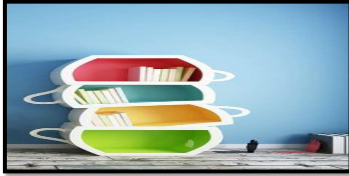
شكل (٢) / مكتبة مصممة على وفق قانون التكرار

برفوف مكتبية مصممة على شكل أكواب متناغمة بشكل إيقاعي (متكرر) . كما ونجد في تصميم (٢) تحرر المصمم من التصميم النمطي للمكاتب متجاوزا المحددات والقواعد والثابت عبر تصميم متحرر يشد انتباه الطفل (المتلقي) ويثير مخيلته .