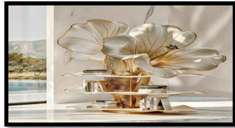
شكل (١٨) / شكل