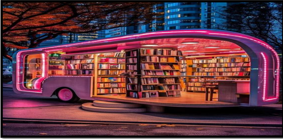
شكل (٩) / وحدة عرض على شكل باص