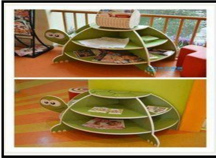
شكل (١٣) / استعارة شكلية للسلحفاة/

٤- السلحفاة : للسلحفاة رمزية غنية وهي متغيرة من بلد لآخر ، ففي الصين تُعد مبعوث نقل الى الجنس البشري أسرار العالم ، بعلامات قوقعتها وكانت بذلك واحدة من العناصر الرئيسية لفن التنبؤ ، وفي الهند تعتبر رمز (ياما) الرافد الرئيسي لنهر الغانج ، وفي دول البحر المتوسط تعتبر السلحفاة رمز الفضائل المنزلية لأنها لا تغادر البيت وهي صامنة (سيرنج، ١٦٣) ، والشكل (١٣) يوضح مكتبة مصممة على شكل سلحفاة .