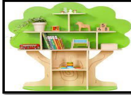
شكل (٦) / مكتبة الشجرة تحقق فيها التناظر جانبي المكتبة

https://www.amazon.com/OOOK-Bookcase-Bookshelf