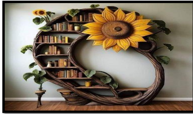
مكتبة على شكل زهرة عباد الشمس - zazzle.com