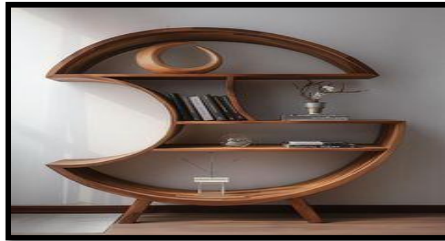
شكل (٨) / مكتبة مصممة وفق قانون الإتساق

نعني به إتساق الكل بنسق واحد بغض النظر عن التباين والإختلاف عن الوحدات التصميمية والتي يجب ، أن تظهر ميلاً واضحاً للتجمع المنسق والمتناغم كما في الشكل (٨) والذي يمثل مكتبة متناسقة التصميم ، يجتمع فيها الإبتكار والبساطة ، كما ولجأ المصمم الصناعي إلى تجريد الشكل وفق مجموعة من الخطوط المتداخلة والمترابطة مع بعضها البعض في وحدة كلية جميلة ومعاصرة .