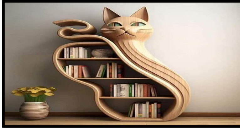
شكل (١٤) / استعارة شكلية للقطعة