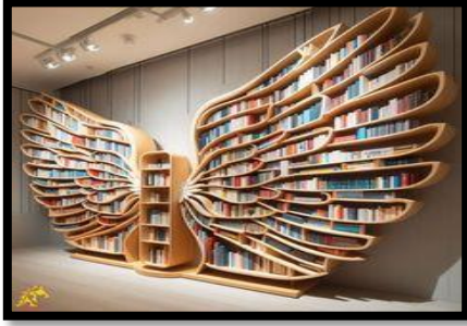
شكل (٧) / تحقق التناظر على