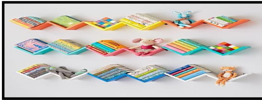
شكل (٣) / مكتبة مصممة على وفق قانون التكرار

يتم من خلال إعطاء بعض التتابع والإستمرار المنظم لعدد من التكوينات الأكثر والأقل تشابها، كما في الشكل (٣) والمتمثل برفوف خشب ملونة مصممة وفق قانون الاستمرار .