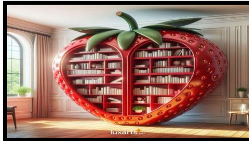
شكل رقم (١٦)