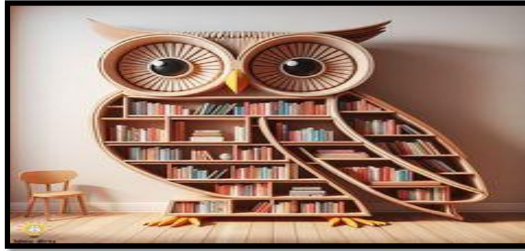
شكل (١٢) // استعارة شكلية للبوامة