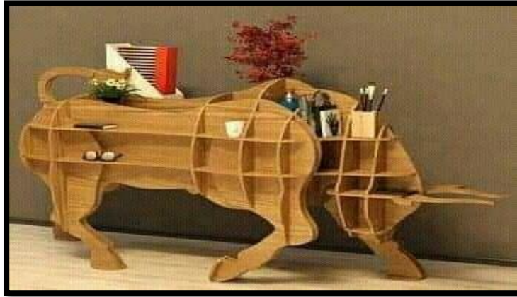
شكل (١٠) / مكتبة مصممة على شكل ثور